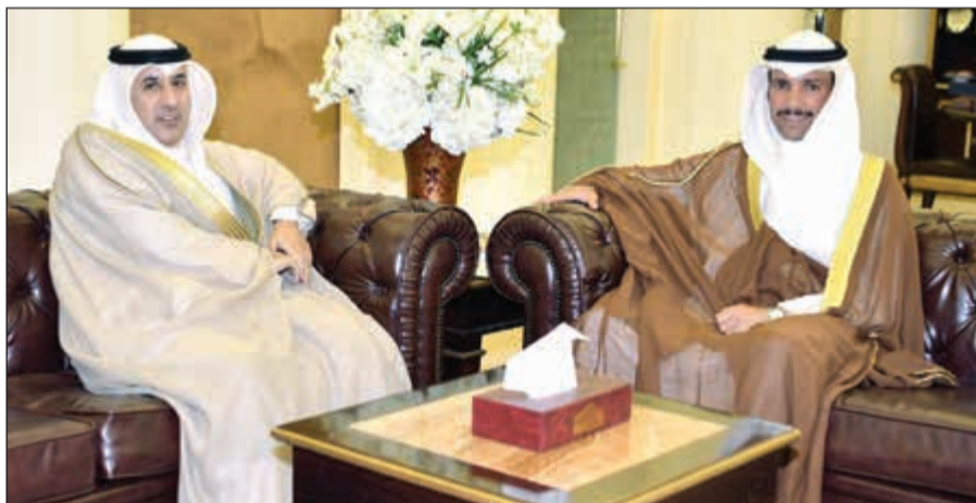
رئيس مجلس الأمة مرزوق الغانم مستقبلاً السفير عزيز الديحاني

بعث رئيس مجلس الأمة مرزوق الغانم أمس ببرقيتين إلى رئيس مجلس النواب في جمهورية أفغانستان الإسلامية عبدالرؤف إبراهيمي ورئيس مجلس الشيوخ فضل هادي مسلم يار عبر فيها عن خالص العزاء وصادق المواساة بضحايا التفجير الإرهابي لأكاديمية تعليمية في العاصمة كابول والذي أسفر عن سقوط العشرات من الضحايا والمصابين. وأعرب الغانم في برقيته