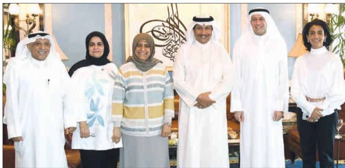
سمو رئيس مجلس الوزراء الشيخ جابر المبارك خلال استقباله رئيس وأعضاء الجمعية الكويتية لجودة التعليم

استقبل سمو رئيس مجلس الوزراء الشيخ جابر المبارك في قصر السفى أمس رئيس وأعضاء الجمعية الكويتية لجودة التعليم وبعض ممثلي مؤسسات المجتمع المدني المهتمة بجودة التعليم.