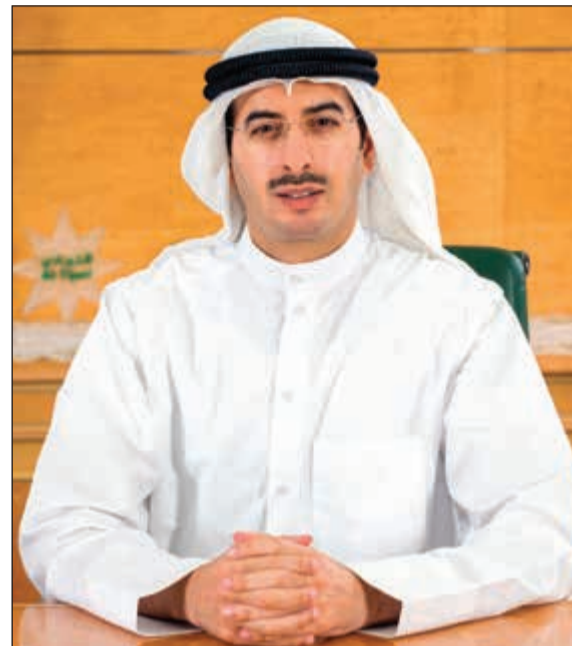
الشيخ أحمد الصباح

من جانب آخر، أكد الشيخ أحمد الصباح أن البنك سيواصل جهوده نحو الاستثمار في النظم التكنولوجية الحديثة ورأسماله البشري لتلبية احتياجات وتوقعات العملاء عن طريق تزويدهم بخدمات مصرفية متطورة ومبتكرة