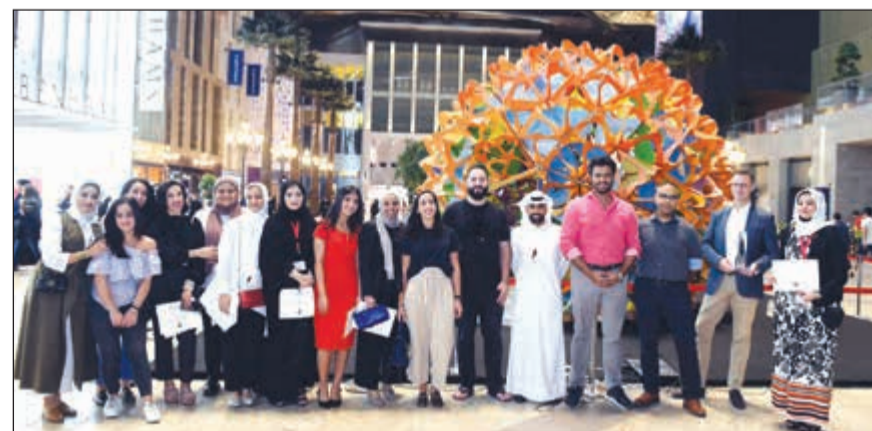
صورة جماعية للمشاركين

استضاف الأقنيز برنامج جامعة «الاتحاد المعماري» البريطانية في زيارتها السنوية للكويت، تحت عنوان «المساحات الحضرية الانسيابية - البناء الناشئ»، وذلك بالتعاون مع كل من جامعة الكويت - كلية الهندسة المعمارية والمكتب العربي - أكبر الدور الاستشارية الكويتية الرائدة في مجال العمارة والتخطيط والهندسة في المنطقة، حيث يستقطب هذا البرنامج عدداً من طلاب الهندسة المعمارية والأكاديميين والمصممين المحترفين في ورشة عمل لتخطيط وتصميم وبناء مجسم معماري فني وعرضه في الأقنيز.