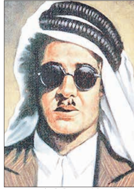
الشاعر الكويتي الراحل فهد صالح العسكر

وفي آخر المطاف، رحل فهد العسكر في 15 أغسطس عام 1951 عن 34 عاما وفقدته ساحة الشعر والأدب مفارقا الحياة في غرفة معزولة سكنها أواخر أيامه بأحدى البنايات قرب سوق «واجف» في قلب العاصمة الكويتية بعد فترة من المرض وهو مثقل بكل ما تعنيه الكلمة بالأسى والألم الشديدين. ودفن الشاعر العسكر في المقبرة قرب قصر نايف وحاول البعض لمس شعره لكن رفيق دربه عبدالله الأنصاري استطاع بعد جهد جهيد جمع ما تبقى من قصائده المكتوبة وجمع ما جاء على لسان قليل من أصدقائه وحفظته ذاكرتهم. وبعد وفاته بسنوات صور له عمل درامي من إنتاج تلفزيون الكويت تكريما له ويوثق مسيرته الأدبية بمراحلها حمل اسم «فهد العسكر الرحلة والرحيل» وتكريما لذكراه أصدرت وزارة المواصلات في عام 2009 طابع يحمل صورته.