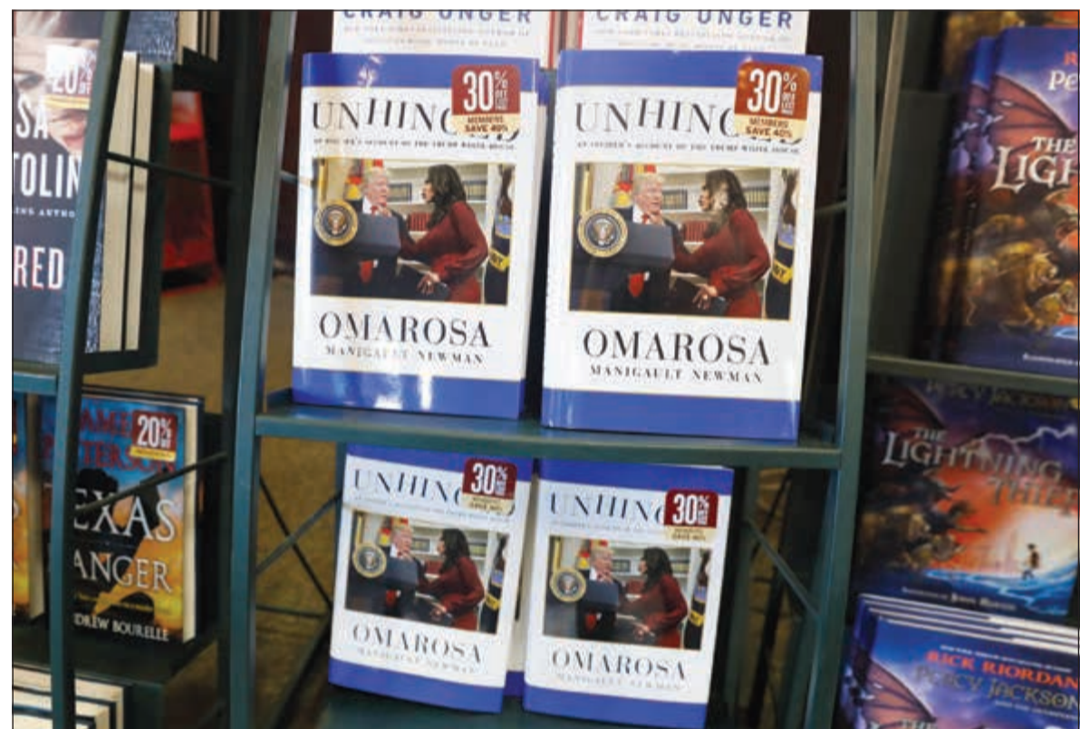
نسخ من كتاب «المعتوه» معروضة بلحدي مكتبات نيويورك اس

واشنطن- وكالات: شن الرئيس الأميركي دونالد ترامب، هجوما لاذعا جديدا موجه على ما يبدو ضد مساعده السابقة أماروسا مانيفولت نيومان، بالتزامن مع صدور كتابها المعنون «المعتوه» الذي يحوي تفاصيل كثيرة عن ترامب ويشكك في قدراته العقلية. ووصف الرئيس ترامب، أمس، مساعدهه السابقة بالسكالب في تغريدة له على موقع التواصل الاجتماعي «تويتر»، وغرد قائلا: «عندما تمنح شخصا مخبولا ووضيعا إجازة. وتعطيه وظيفة في البيت الأبيض، اعتقد أن ذلك لم يقلح». وأضاف: «كان عملا جيدا من الجنرال جون كيلي إقالة هذه الكلبة سريعا». ولم يذكر ترامب اسم مانيفولت نيومان تحديدا في تغريدته. ويقدم كتاب مانيفولت نيومان الذي صدر أمس، يقدم تفاصيل قاسية عن ترامب وأسرتة. وقالت مانيفولت-نيومان في كتابها أنها شاهدت ترامب عام 2017 وهو يتلغ وثيقة رسمية سرية بعد اجتماع مع محاميه مايكل كوهين، مضيفة: «ادهشني أنه وضع الوثيقة في فمه وكان يعضها ومن ثم ابتلعها، علما أن ترامب لديه خشية من الجرائم، لهذا شعرت بالصدمة لأنه مضغ الورقة وابتلعها، ما يؤكد أنها كانت تحتوي على معلومات حساسة للغاية»، وذلك بحسب ما نشرته صحيفة «واشنطن بوست» مستندة إلى مقتطفات من الكتاب. وأشارت الصحيفة إلى أن مسؤولين آخرين في البيت الأبيض لم يؤكدا صحة المعلومات التي قدمتها مانيفولت-نيومان، بل «ضحكوا من هذا الافتراض ونفوا صحته». كما تزعم نيومان أنها اضطرت إلى جانب موظفين آخرين في البيت الأبيض، إلى التوقيع على اتفاق بعدم الكشف عن