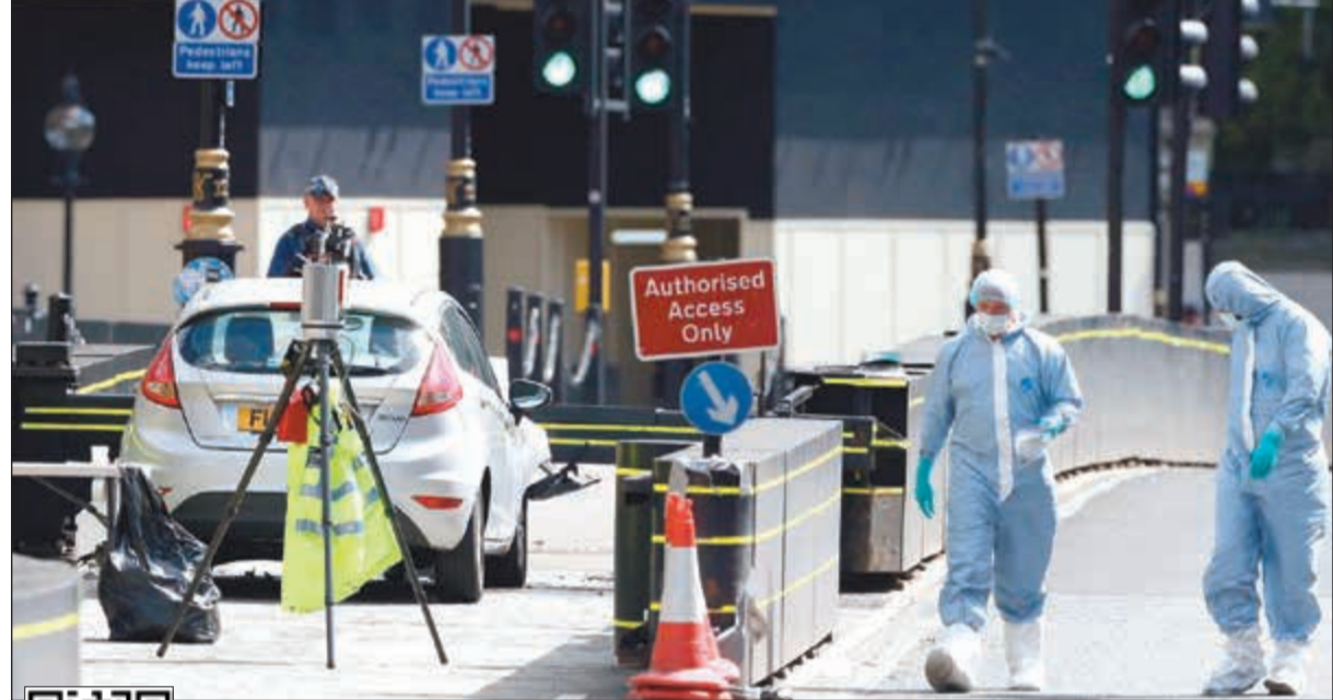
رجال المباحث يحققون في موقع حادث الدهس قرب البرلمان البريطاني

اللون بعد صدمها الحواجز الأمنية، مصوبين أسلحتهم إلى السائق لدى إخراجهم من السيارة. ونشرت صور في وقت لاحق يظهر فيها شرطيون يسكون بالرجل مكبلا وهو يرتدي سروال جينز وسترة سوداء بعد إقفال الطرق ومحطات قطارات الأنفاق المحيطة بالبرلمان. وأعلنت الشرطة أن «سائق السيارة، وهو رجل في أواخر العشرينيات من عمره.. تم توقيفه بشبهة الإرهاب». وقال جهاز الإسعاف التابع للندن إن مسعفيه عاجلوا شخصين في مكان الحادثة من إصابات غير خطيرة ثم نقلوهما إلى المستشفى. وكتبت رئيسة الحكومة تيريزا ماي التي تقضي حاليا إجازة في سويسرا على تويتر أن «مشاعري مع المصابين في حادثة وستمنستر وشكري لأجهزة الطوارئ لتحركها الفوري والشجاع». كما قدم عمدة لندن صادق خان شكره لمن تعاملوا مع