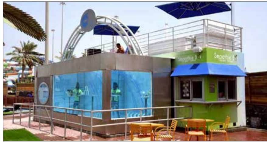
«الأكسجين بار» متعة وترية مميزة

«قلو هاوس أكوابارك» تقوم على بناء فريق متخصص للمشاركة بالبطولات الخليجية والعالمية لتمثيل الكويت في هذه الرياضة الجديدة.