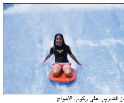
من التدريب على ركوب الأمواج

آملين أن نلقى الدعم من الهيئة العامة للرياضة والشباب وأن يتم إدراج هذه الرياضة من ضمن النشاطات الرياضية المعتمدة في الكويت.