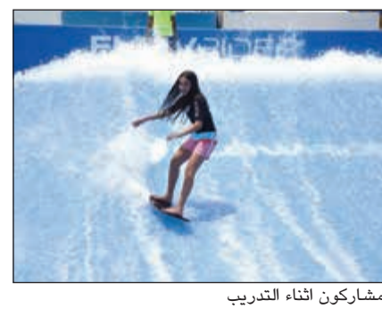
مشاركون أثناء التدريب

أفصحت مدينة الألعاب المائية «الأكوابارك» عن إقامة مهرجان «امسح واربح»، وذلك بمناسبة مرور 23 عاماً من العطاء للسياحة الداخلية في الكويت بتميز وتطور مستمر خلال الأعوام الماضية، وستكون مدة المهرجان شهراً ابتداءً من تاريخ 8 / 17 لغاية 9 / 17 وسوف يتم تقديم أكثر من 16 ألف جائزة.