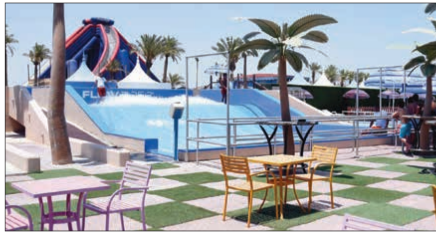
ركوب الأمواج المتقلبة