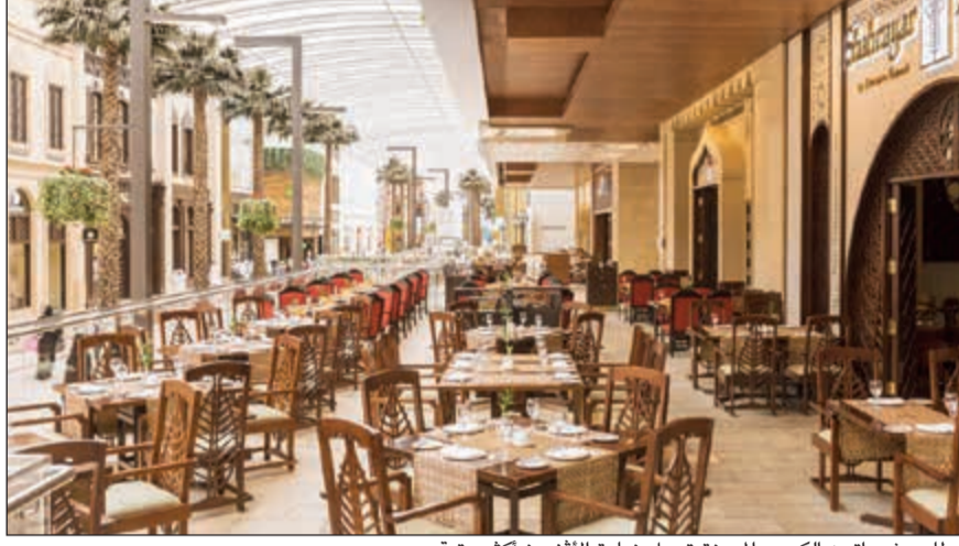
مطعم شيراتون الكويت المميزة تجعل زيارة الأضياف أكثر متعة

تدعوك فنادق شيراتون الكويت وفوربوينتس شيراتون الكويت للاحتفال بعيد الأضحى المبارك بأجواء استثنائية يتم العمل على التحضير لها لتجعل من هذه المناسبة فرصة ليجتمع الأهل والأحبة ويلتقي الأصدقاء في أجواء فاخرة لطالما تميز بها فندق شيراتون الكويت العريق. تحضر مطاعم الفندق العديد من الخيارات المتنوعة والتي يتم تقديمها بأرقى معايير الخدمة ولتتناسب مع كل الأذواق. مطعم الحمراء يقدم بوفيهها غنيا بأشهى الأصناف ومختلف الأطباق من حول العالم بالإضافة إلى المأكولات الصحية التي لها عشاقها. ومن موقعها المطل على الخليج العربي ومركز الشيخ جابر الأحمد الثقافي تقدم كل من مطاعم الطربوش اللبناني، بخارى الهندي وشهرير الإيراني أشهى المأكولات المحضرة على أيدي طهاة مختصين يبرعون في تقديم طعم الأصالة بشغف. هذا ويحرص مطعم ريكاردو الشهير على استقبال رواده لقضاء أعلى الأوقات وتذوق أفخر الأطباق الإيطالية، أما المقهى الإنجليزي فيستقبلكم كعادته صباحا ومساءً بأجوائه الكلاسيكية وخدمته الراقية التي تميزه دائما. كل هذا وأكثر في مجمع الأضياف، حيث تنتظركم مطاعم