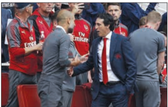
الخسارة الأولى لإيمري على يد غوارديولا

كشف مدرب مان سيتي بيب غوارديولا عن رضائه بالأداء الذي قدمه فريقه بالجوالة الأولى من الدوري الإنجليزي بعد الفوز على بهدي رحيم سترلينغ (14) وبرناردو سيلفا (64) على ملعب الإمارات. وتحدث غوارديولا لإذاعة «بي بي سي» حول اللقاء ونتيجته، قائلاً: «هل كان الأداء المثالي؟ نعم. لدينا الكثير من اللاعبين الذين يعانون من نقص في الحالة البدنية ولكننا معاً منذ أكثر من موسمين ونعرف ما يجب القيام به». وأردف «لقد حققنا أداء جيداً بشكل عام وسنقدم يوماً بعد يوم الأفضل. أنا محظوظ بأن أكون مدرباً لمان سيتي، نحاول أن نبذل قصارى جهدنا دائماً. أعطاني النادي تشكيلة رائعة. لا أستطيع تقديم أي شكوى ولو لدقيقة واحدة». ويبحث عنه خلال موسمه الحالي مع سيتي «كل