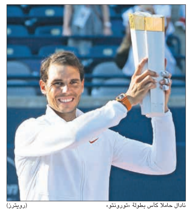
نادال حاملاً كأس بطولة «تورونتو»

تورونتو «أنا أسف جداً لأعلن أنني لن أشارك في دورة سينسيناتي هذا العام، السبب هو شخصي لأنني أردت الاعتناء بجسدي ومحاولة البقاء في صحة جيدة كما أشعر الآن». وأحرز نادال في تورونتو خامس لقبه هذه السنة، وأبرزها لقب بطولة رولان غاروس الفرنسية، ثنائية البطولات الكبرى، للمرة الـ 11 في مسيرته. كما رفع اللاعب الإسباني رصيده إلى 80 لقباً في مسيرته والثالث والثلاثين في دورات الماسترز.