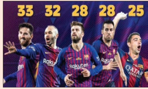
ميسي يسجل تاريخاً جديداً

للأندية، و6 في كأس الملك، و3 في كأس السوبر الأوروبي، و8 في كأس السوبر الإسباني. وحصد ميسي هذه الألقاب مع 6 مدربين هم فرانك ريكارد، بيب غوارديولا، تيتو فيلانوفو، تاتا مارتينو، لويس إنريكي، وأخيراً المدرب الحالي إرنستو فالغيردي. ويات ليونيل ميسي أكثر لاعب يتوج بلقب كأس السوبر الإسباني به الألقاب، وسجل 13 هدفاً في 18 مباراة، وهي أول بطولة يفوز بها ميسي كقائد أول للفريق الكاتالوني.