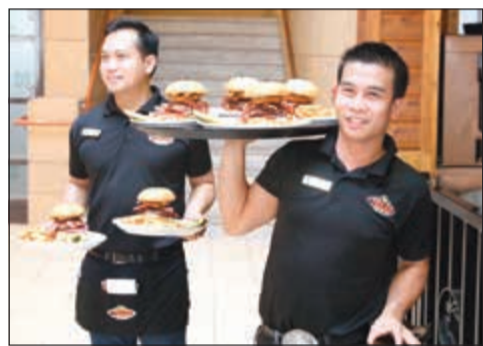
برغر مميز من «تكساس رودهاوس»