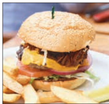
أشهى برغر في «تكساس رودهاوس»