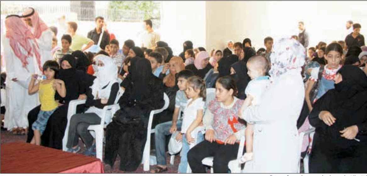
آلاف الأيتام مع أهليهم ينتظرون كسوة العيد

أن مشروع كسوة العيد يعد امتداداً لأفك الخير والإحسان لنزاع لباس البؤس والحرمان من على أجساد أطفال الفقراء البهجة والسرور ليكون للطفولة رونقها وبهاؤها ويصعب للعيد معناه. وبين أن المشروع يعد لمسة حانية من أهل الخير وأصحاب الأيادي البيضاء لغرس السعادة في نفوس هؤلاء الأيتام في يوم العيد، فتطوي لتلك الأيادي التي تمتد في مثل هذا اليوم لنزاع البسمة في وجوه الصغار فتحل السعادة في نفوس الكبار.