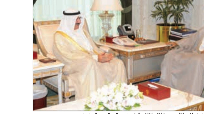
سمو ولي العهد الشيخ نواف الأحمد خلال لقائه الشيخ سالم العبد العزيز