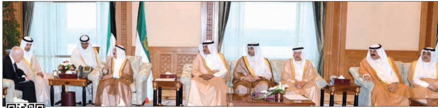
صاحب السمو الأمير الشيخ صباح الأحمد مستقبلاً المدير العام للمنظمة الدولية للهجرة وويليام لاسي سوينغ بحضور الشيخ صباح الخالد والشيخ محمد عبدالله والسفير أحمد فهد الفهد وخالد الجارالله