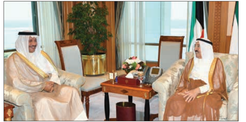
صاحب السمو الأمير الشيخ صباح الأحمد خلال لقائه سمو رئيس مجلس الوزراء الشيخ جابر المبارك

يمكن استخدام QR كود أو مشاركة الفيديو أو أو أو