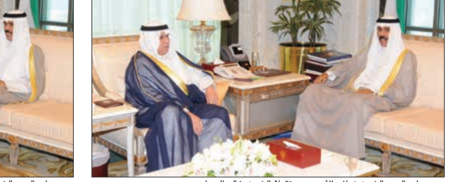
سمو ولي العهد الشيخ نواف الأحمد مستقبلاً الشيخ خالد الجراح

كما استقبل سمو ولي العهد نائب رئيس مجلس الوزراء وزير الدفاع بالإنيابة الشيخ خالد الجراح. والسفير محمد الطويري وعدد من مسؤولي وزارة الخارجية.