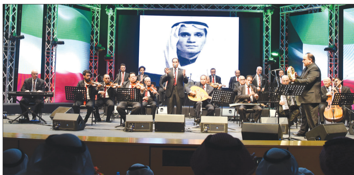
جانب من فقرات الحفل