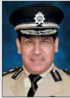
الفريق عصام النهام

بتصليح المركبات دون إذن تصليح إلى التحقيقات لاتخاذ الإجراءات القانونية بحقهم إذ أن القانون يحتم على أي صاحب كراج أو عامل عدم تصليح أي مركبة دون إذن تصليح. واستناداً إلى مصدر أممي فإن وكيل وزارة الداخلية الفريق النهام وخلال إشرافه شخصياً على حملة محافظة الجهراء والتي نفذت الأسبوع الماضي