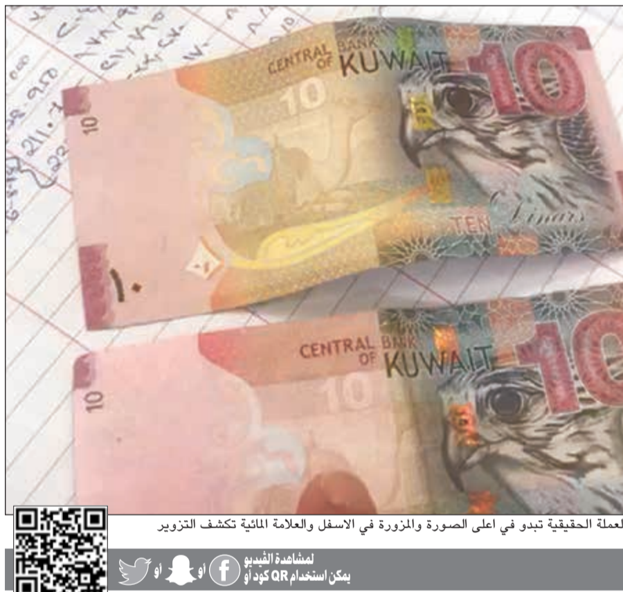
العملة الحقيقية تبدو في أعلى الصورة والمزورة في الأسفل والعلامة المائية تكشف التزوير

ترجيحات بأن تكون العملة المزورة أعدت بواسطة مكان تصوير متقدمة