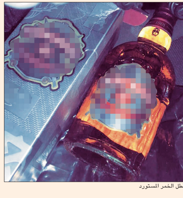
بطل الخمر المستورد

أمر مدير امن محافظة الفروانية اللواء ركن صالح مطر بإحالة مواطن الى الإدارة العامة للمخدرات بعد ضبطه ويحوزته بطل خمير مستورد وتم ارفاق المضبوطات بالإحالة. وقال مصدر امني ان احدي دوريات امن الفروانية كانت في جولة اعتيادية في نطاق المحافظة وتمت مشاهدة مركبة كان قائدها يرتج بين حارات الطريق وعند توقيفه تبين انه خارج نطاق