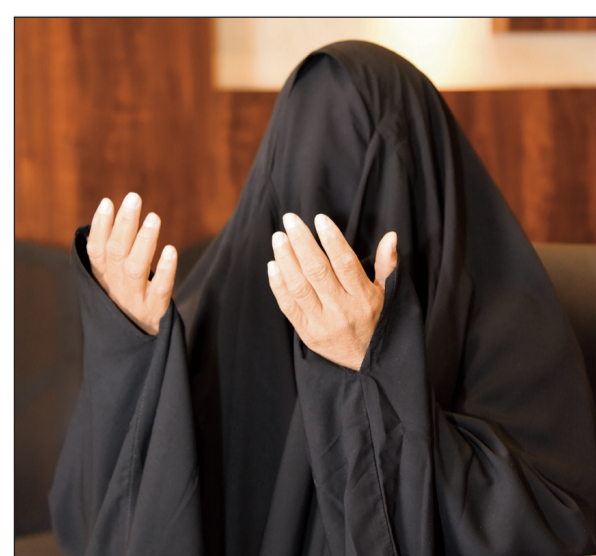
المتسولة لدى حديثها لـ «الأنباء» (محمد هندواوي)

«أعترف بانني أخطأت في حق أولادي وأهنت نفسي عندما سلكت هذا المسلك، ولكن ماذا كان يمكنني أن أفعل بعد أن طلقني زوجي وهرب، وأصبحت فجأة مسؤولة عن كل متطلبات أبنائي الثلاثة، وليس لي دخل». هكذا بدأت السيدة الأربعينية (ب.ن.ح) التي لجأت واستغاثت بـ «الأنباء» بحثا عن حل لمشكلتها. قالت: أنا سيدة مطلقة من فئة غير محددى الجنسية، من مواليد 1975، أكملت السنة الرابعة الثانوية، ولم أتمكن من الالتحاق بالجامعة، نظرا للظروف الاجتماعية، ثم