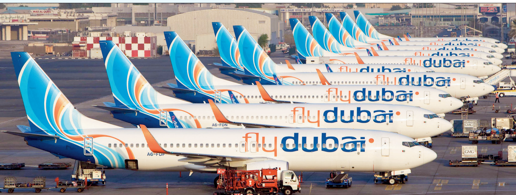
أسطول طائرات «فلاي دبي»