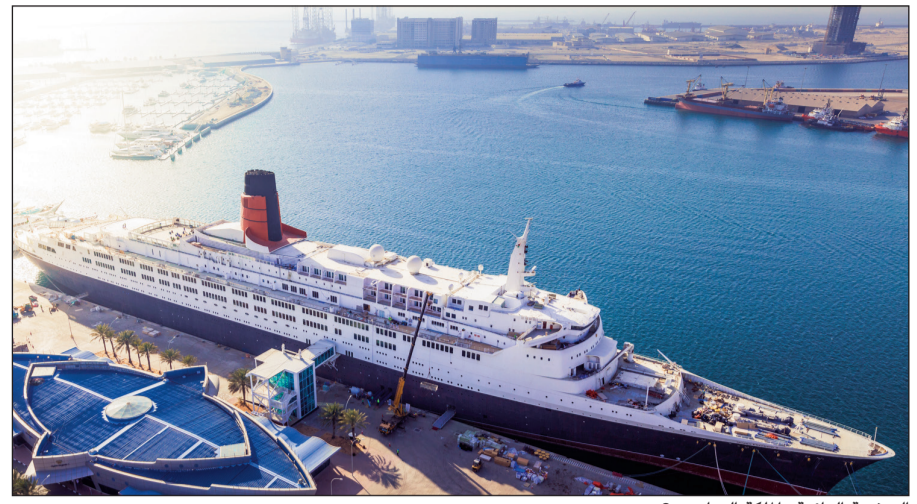
السفينة العائمة «الملكة إليزابيث 2»