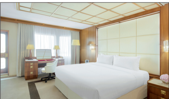
جناح «الملكة إليزابيث 2»