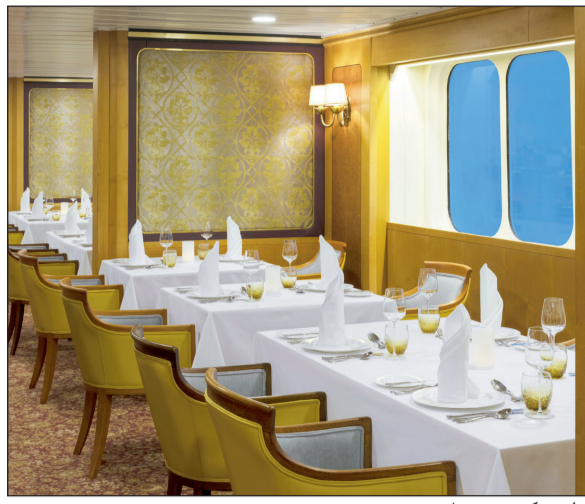
مطعم «كوينز جريل»