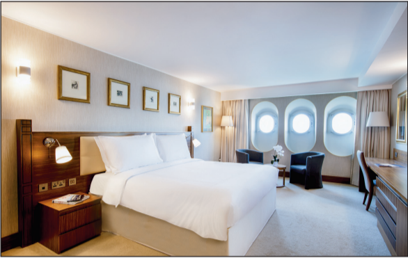
إحدى غرف الديلوكت