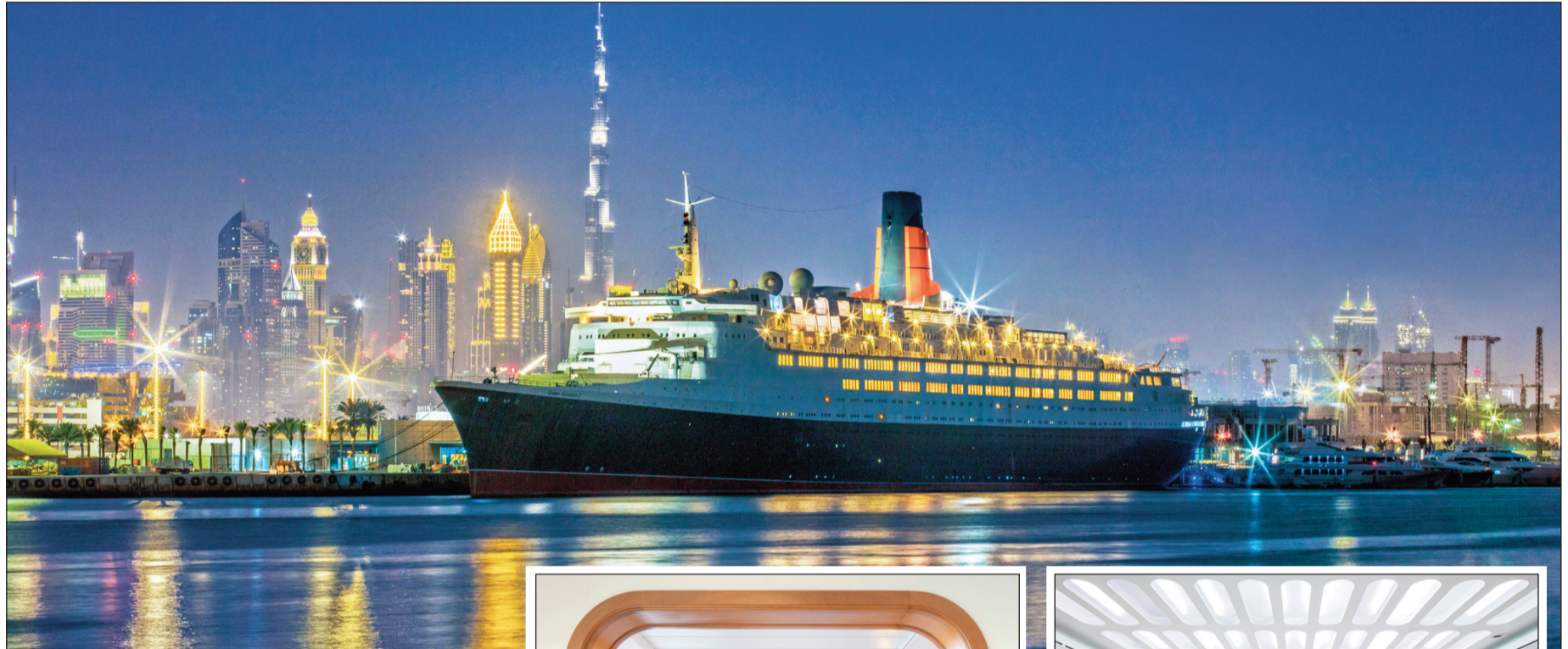
إطلالة ليلية للسفينة