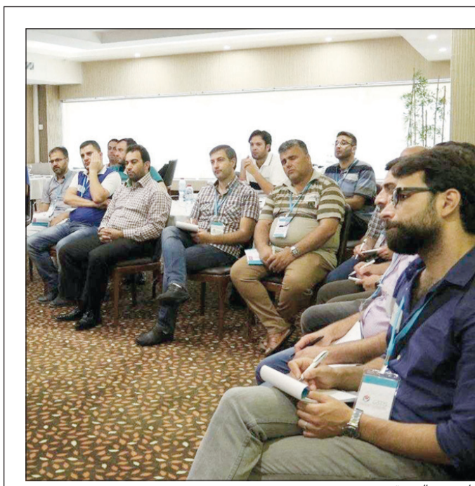
جانب من الدورة