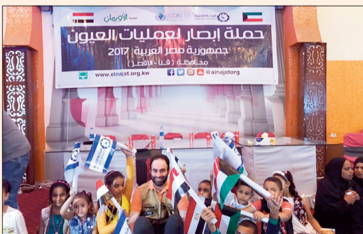
جانب من حملة «إبصار» في مصر