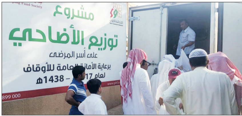
جانب من توزيع الأضاحي العام الماضي