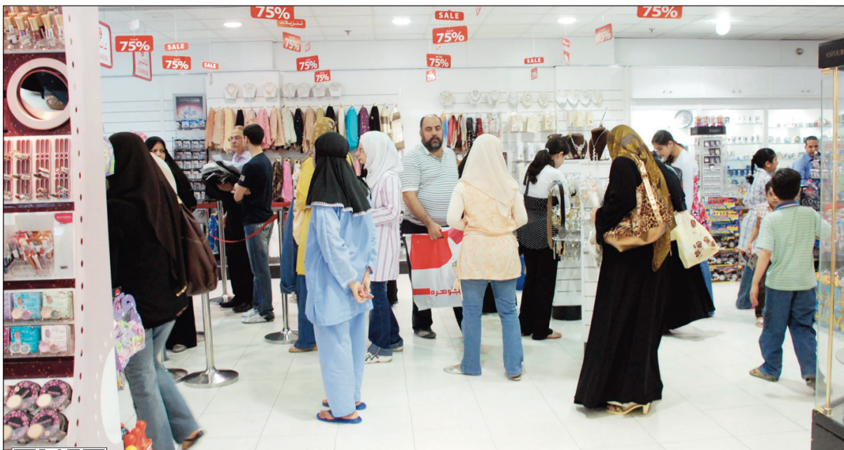
التنزيلات وسيلة الأسواق لجذب المستهلكين في مواجهة حالة الركود