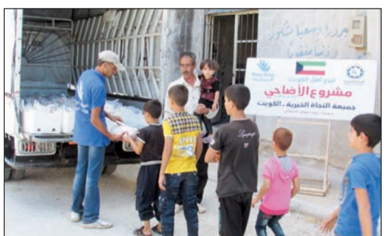
زكاة كيفان تعمل على توصيل الأضاحي للمستحقين بالداخل والخارج

في إيصالها للمستحقين وتوثيقها ونشرها عبر شتى منصات التواصل الاجتماعي وبالصحف ليشاركها المحسنون ثمار تبرعاتهم. مبيناً أن مشروع الأضاحي من المشاريع الموسمية الهامة التي تنفذها اللجنة في دول اللجوء السوري والأجانب الرومانيين وكذلك دولة الصومال الشقيق ودول البانيا والدول الآسيوية وغيرها من دول العالم، على إدخال الفرح والسرور على