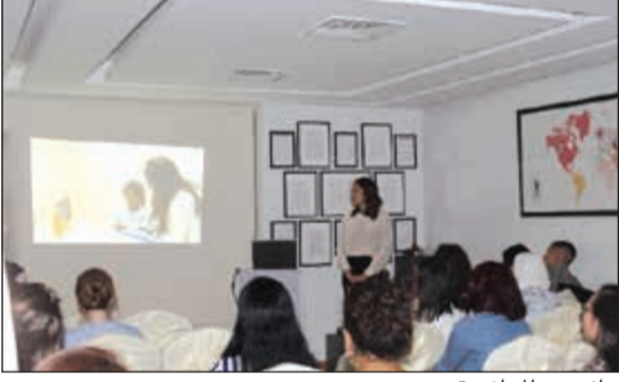
جانب من المحاضرة

علاجيين متميزين وطاقت استشاري عالمي ووسائل تعليمية متطورة لخدمة الأطفال وذويهم، بالإضافة إلى توفير برامج تدريبية لأسر هؤلاء الأطفال لتعليمهم أسس ومفاهيم التدخل السلوكي الذي يقوم بتطبيقه وتدريبهم على كيفية التعامل مع أبنائهم خارج المركز. سواء كان ذلك بالبيت أو بالبيئة الخارجية، ونسعى لزيادة الوعي المجتمعي اللازم بقضية التوحد والعمل على تحسين حياة أطفالنا وتطوير قدراتهم، ولهذا نقوم بتنظيم ندوات ومحاضرات للامة والمختصين بشكل مستمر على مدار العام حرصا منا على الوصول لأقصى قدر من الاستفادة الممكنة لهم ولأبنائهم.