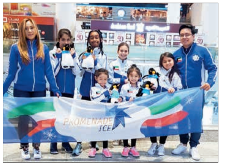
فريق «البروميناد آيس»

الذين تتراوح أعمارهم من 5 سنوات وحتى 11 سنة، يشارك كل منهم بالعديد من فقرات البطولة. وتم إعداد الفريق لهذه البطولة من خلال برنامج تدريبي مكثف على أيدي مدرّبين محترفين أقيم في حلبة تزلج بروميناد آيس الكائنة في مول البروميناد ويسعى البروميناد