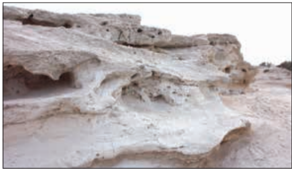
الصخور الساحلية تحتوي على أحافير مهمة