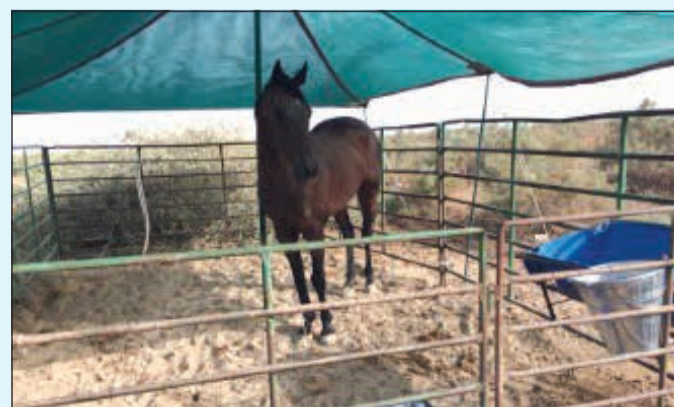
خيول في أراض غير مخصصة للرعي