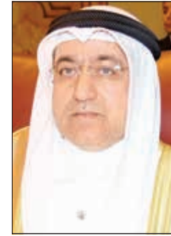
م. محمد بوشهري

أعلن وكيل وزارة الكهرباء والماء م.محمد بوشهري عن التنسيق مع ديوان الخدمة المدنية في شأن كشف الشهادات المزورة حرصا على منع كل ذي حق حقه وفقا للقانون، ودون التعدي على حقوق الآخرين من خلال شهادة تم تزويرها. وقال م.بوشهري إن حالتي