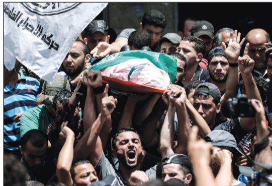
فلسطينيون يشيرون جثمان أحد شهدي «القسام» الذين قُضيا في قصف إسرائيلي على غزة أمس (أ.ف.ب)

عواصم - وكالات: قدم مركز حقوق الفلسطينيين داخل إسرائيل، التماسا إلى المحكمة العليا الإسرائيلية، ضد قانون الدولة القومية الذي أقره الكنيست قبل أسبوعين. وقال المركز القانوني لحقوق الأقلية العربية في إسرائيل (عدالة) إنه قدم الالتماس، نيابة عن «لجنة المتابعة العليا للجماهير العربية في الداخل»، والقائمة العربية المشتركة في الكنيست، ولجنة رؤساء السلطات المحلية العربية. واعتبر الالتماس إن «دولة إسرائيل تحولت بعد سن قانون القومية بشكل رسمي لجسم صهيوني ينافس صندوق أراضي إسرائيل، إذ تعلن بشكل واضح في دستورها أنها موجودة فقط لخدمة مصالح اليهود، وبناء على ذلك عليها إقصاء العرب من أجل تطوير وتشجيع الاستيطان اليهودي». ميدانيا، نفت