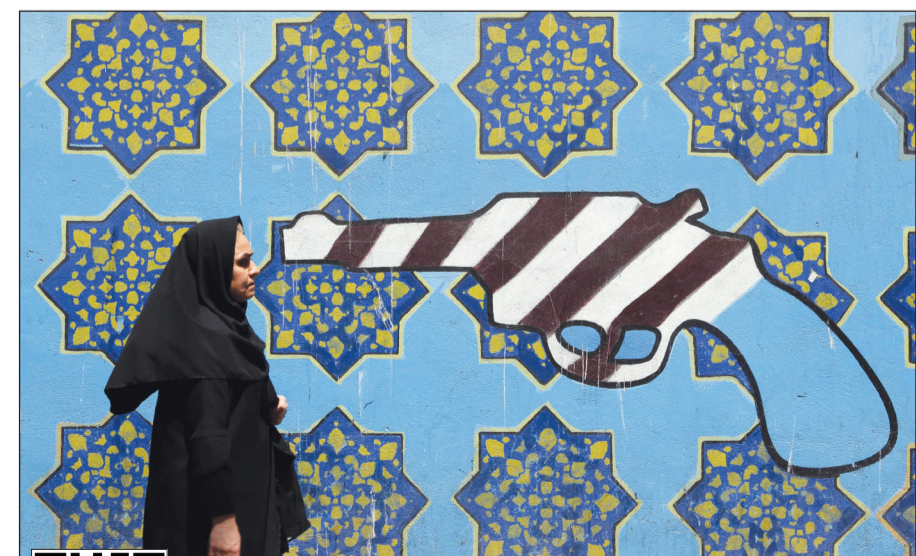
إيرانية تسيّر بجانب لوحة جدارية على حائط السفارة الأميركية السابقة في طهران أمس

واستبعد التفاوض مع الأميركيين في ظل العقوبات، وقال في مقابلة تلفزيونية إن إجراء «مفاوضات مع عقوبات هو أمر غير منطقي». وجاءت تصريحات روحاني ردا على توجيه ترامب قبل ساعات تحذيرا جديدا لإيران، مبديا في الوقت نفسه «انفتاحه» على «اتفاق أكثر شمولا يتعاطى مع مجمل أنشطة الضارة».