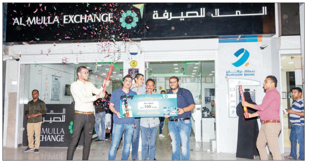
تسليم أحد الفائزين جائزته

بسهولة استخدامه، تم تزويده بواجهة مستخدم تفاعلية للغاية، فضلاً عن سهولة المناورة عبره، كما أن المنصة المتوافرة عبر الإنترنت الإلكتروني أو تطبيق الملا للصيرفة، وكونها شركة رائدة في مجال الصيرفة، حققت شركة الملا مؤخراً إنجازاً جديداً في هذا المجال عبر إطلاقها تطبيقاً خاصاً للتحويلات المالية هو الأول من نوعه بالصيرفة، وضمن فترة قصيرة، حقق التطبيق نسبة تحميل عالية عبر منصتي أندرويد و iOS، التطبيق الذي يتميز