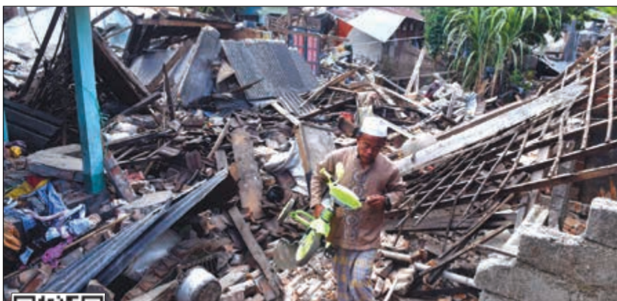
إندونيسي يحمل دراجة صغيرة وسط الدمار الناتج عن الزلزال