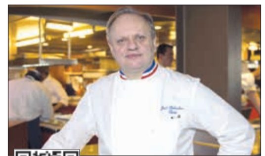
الطاهي الفرنسي جويل روبوشون