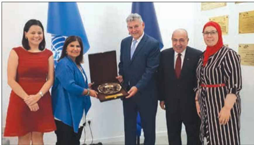
تكريم في مقر منظمة السياحة العالمية بين العنجرى والبرتو كابل وبيدو ناجيا وبعض فريق عمل المنظمة

اجتمعت مع «السياحة العالمية» وجامعة «آي إي» لإدارة الأعمال «ليدرز جروب» تبحث تنشيط السياحة الكويتية مع منظمات عالمية