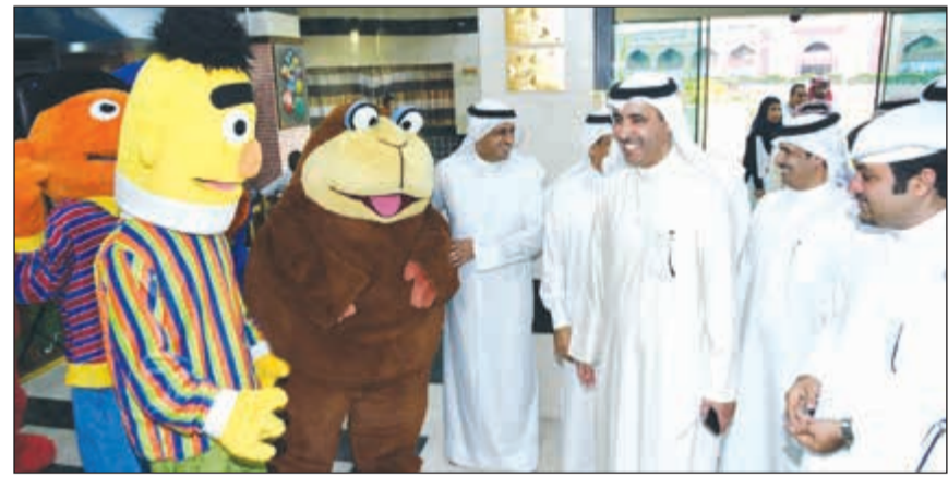
جولة السفير حمد المري داخل مبنى مؤسسة الإنتاج البرامجي المشترك

وفي ختام جولته الى مقر الإنتاج البرامجي المشترك المساعد للمشؤون التشريعية والقانونية في الامانة العامة لمجلس التعاون الخليجي: محل اعتزاز واقتدار ما شاهدناه اليوم، حقيقة يثلج الصدر. اليوم نأكد لنا فعلا ان مسألة الاستمرار والتجديد والتطور ما هي الا قرار. وهذا القرار وبكل جدارة استطاع ان يتخذه الاخ علي الريس مدير عام مؤسسة الإنتاج البرامجي