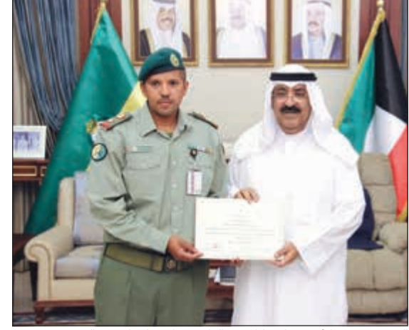
الشيخ مشعل الأحمد مكرماً المقدم الركن عزام سليمان عبدالرحمن

دائماً إلى الارتقاء بالعنصر البشري ومواكبة أحدث المستجدات في مجال العلم والتدريب، تطبيقاً لوثيقة الأهداف الاستراتيجية للحرص الوطني 2020