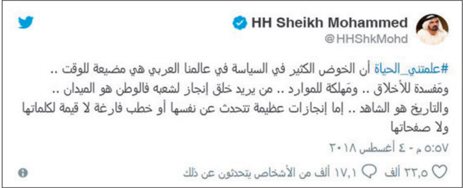
جانب من تغريدات الشيخ محمد بن راشد

ولدينا نقص في الإداريين. أزمنا أزمة إدارة وليست موارد.. انظر للصين واليابان لا يملكان موارد طبيعية آبن وصلوا؟!.. وانظر لدول تملك النفط والغاز والماء والبشر، ولا تملك مصيرها التنموي.. ولا تملك حتى توفير خدمات أساسية كالطرق والكهرباء لشعوبها». وأردف قائلاً: «في عالمنا العربي.. السياسي هو من يدير الاقتصاد، ويدير التعليم، ويدير الإعلام، ويدير حتى الرياضة؛ وظيفة السياسي الحقيقية هي تسهيل حياة الاقتصادي والأكاديمي ورجل الأعمال والإعلامي وغيرهم».