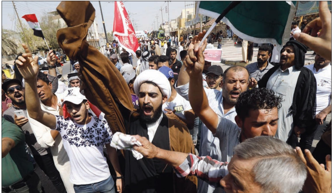
محتجون غاضبون يطلقون شعارات ضد الحكومة في مظاهرات البصرة أمس

عواصم - وكالات: تظاهر مئات العراقيين الغاضبين من الأوضاع المعيشية الصعبة وسوء الخدمات في عدة مناطق عراقية، فيما تعصف الخلافات بالأحزاب والكتل البرلمانية، لتتصاعد الكفة السياسية بعد 3 أشهر من الانتخابات التشريعية التي لم تسفر بعد عن تشكيل حكومة جديدة تلبى مطالب الغاضبين.