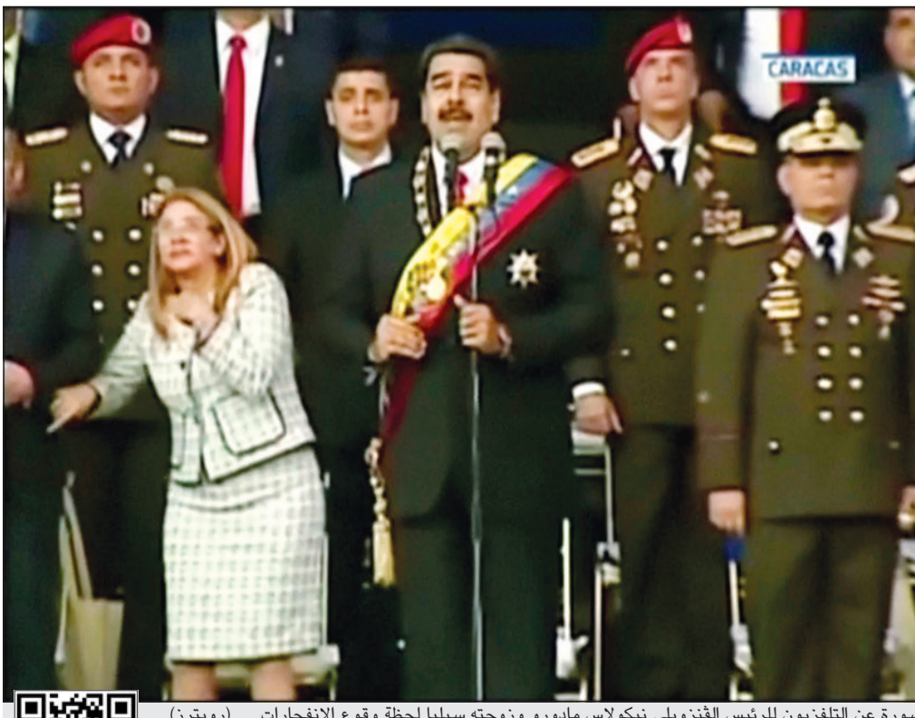
صورة عن التلفزيون للرئيس الفنزويلي نيكولاس مادورو وزوجته سيلييا لحظة وقوع الانفجارات

وأضاف أن أي اتفاق نهائي بخصوص غزة سيتطلب ضمان إعادة جنديين إسرائيليين قتل عام 2014 ومدنيين قتلوا في القطاع. ولم تعلن الأمم المتحدة ومصر مقترحاتهما للتهدئة في غزة بالتفصيل، لكنهما تحدثتا بشكل عام عن الحاجة لتحسين الأوضاع الإنسانية في غزة ووقف الأعمال العدائية عبر الحدود والمصالحة بين حركتي حماس وفتح. وفي السياق، قالت وزيرة العدل إيليت شاكيد، حسب القناة العاشرة الإسرائيلية، إن أي اتفاق مع حماس يجب أن يضمن غزة بدون سلاح، إضافة إلى إعادة جثث الجنود المحتجزين من جهته، قال وزير المواصلات والاستخبارات يسرائيل كاتس، حسب صحيفة «معاريف» إنه سيرعى خطة تهدف إلى الانفصال التام عن قطاع غزة. وأشار كاتس إلى أن خطته تهدف إلى اشتراط عدم تقديم أي مساعدات للقطاع، قبل إعادة جثث الجنود. بدوره، قال وزير البناء والإسكان يواف غالانت، حسب صحيفة «يديعوت أحرنوت»، إنه من الصعب التوصل لاتفاق طويل المدى مع حماس. وأفاد بأن الضغوط التي تمارس على حماس وغزة أتت بنتائجها وجعلتهم يعيدون حساباتهم. ميدانياً، أصيب شخصان بجروح طفيفة أمس اثر ضربات نفذتها طائرة إسرائيلية بدون طيار على منشأة تابعة للمقاومة الفلسطينية شمال غزة. وأفاد مسؤولون أمنيون في القطاع بأن المنشأة الواقعة شمال بلدة بيت لاهيا كانت تستخدم من قبل مجموعة صغيرة يطلق عليها اسم «المجاهدين».