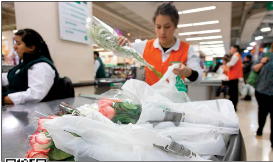
مهلة في 6 أشهر للمتاجر الكبرى للتخلص من الأكياس البلاستيكية