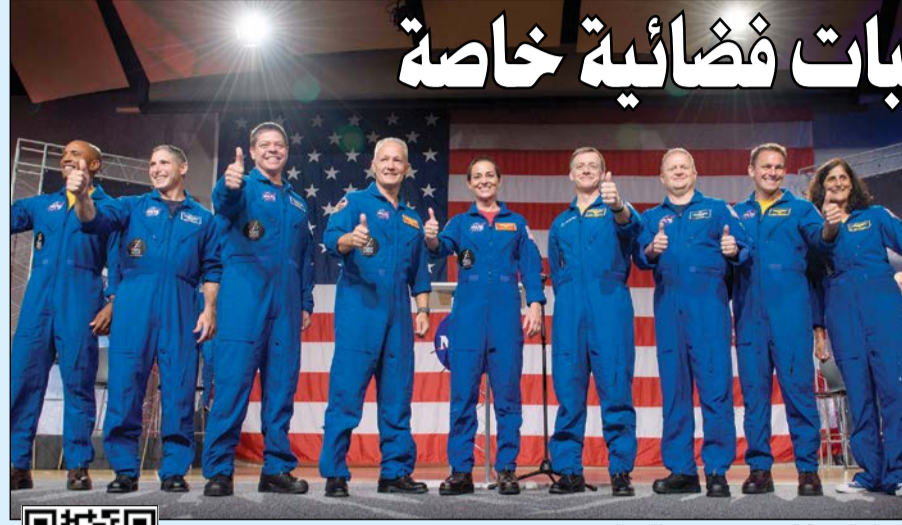
الرواد التسعة الذين سيتوجهون للفضاء في 2019