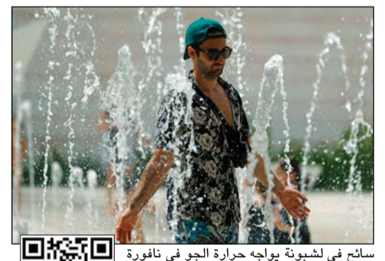
سائح في لشبونة يولج حرارة الجو في نافورة