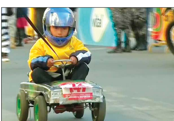
أحد الأطفال المشاركين في السباق