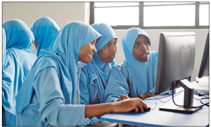
الطلبات في أحد الفصول

وتستمر جمعية العون المباشر في التركيز على المشاريع التعليمية والتي أضافت نقلة نوعية في أوساط المجتمعات القريبة الغفيرة بالتحاق أكثر من 90 ألف طالب في مؤسساتها حاليا، بالإضافة لإدارتها لـ 4 جامعات تتابع الارتقاء بمستواها الأكاديمي والتوسع في تخصصاتها ومنشأتها الحديثة.