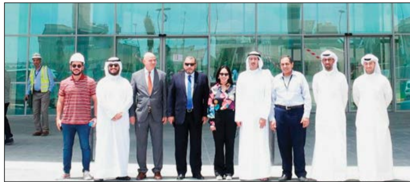
لقطة تذكارية أمام المستشفى

التمويل اللازم لهذا المشروع الضخم الذي يعتبر علامة وإضافة بارزة في قطاع الخدمات والرعاية الصحية المتكاملة في دولة الكويت، وتابع مؤكداً أهمية تمويل مثل هذه المشاريع الصحية في الكويت التي توفر خدمات طبية متميزة للمواطنين في الكويت.