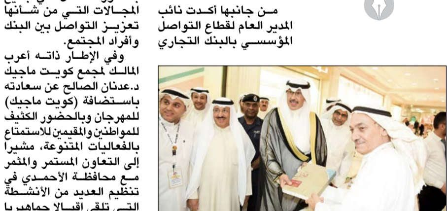
الشيخ فواز الخالد خلال جولة في لجنة المعرض