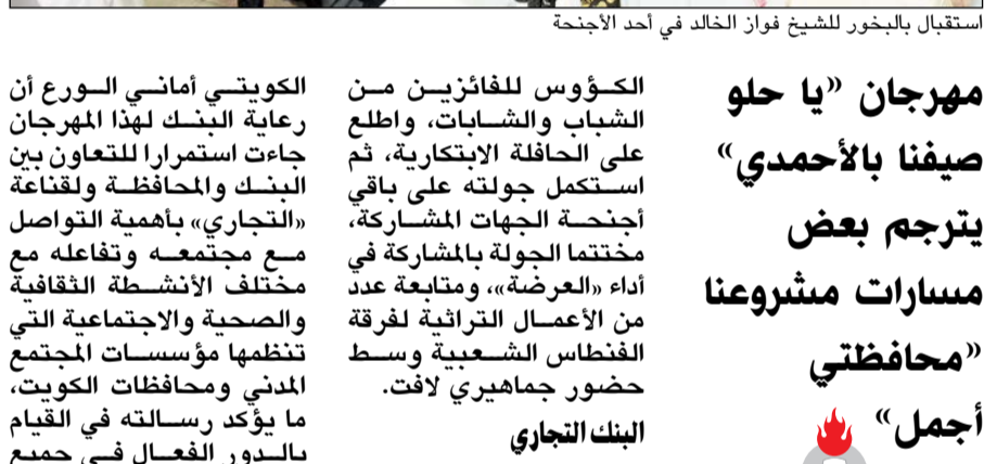
الشيخ فواز الخالد خلال جولة في لجنة المعرض