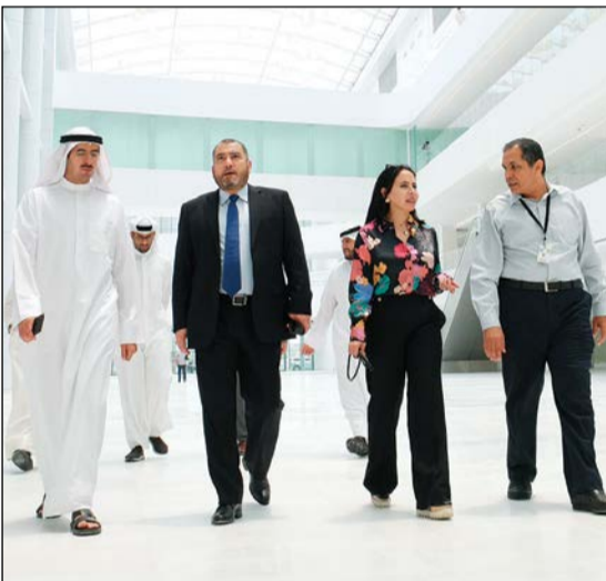
جولة في المستشفى

وفي هذا السياق أعرب رئيس مجلس إدارة البنك التجاري الشيخ أحمد الصباح عن اعتزاز وفخر «التجاري» بمساهمته بتمويل مشروع مدينة الجهراء الطبية قائلاً: «نحن سعداء في البنك التجاري الكويتي بترتيب