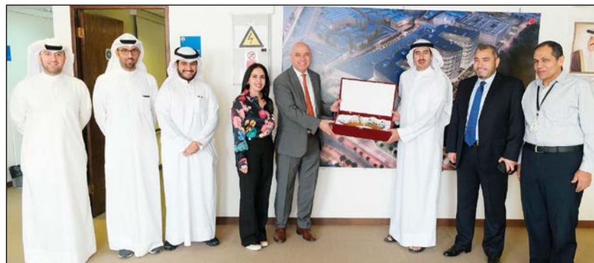
درع تكريمية لـ«التجاري»