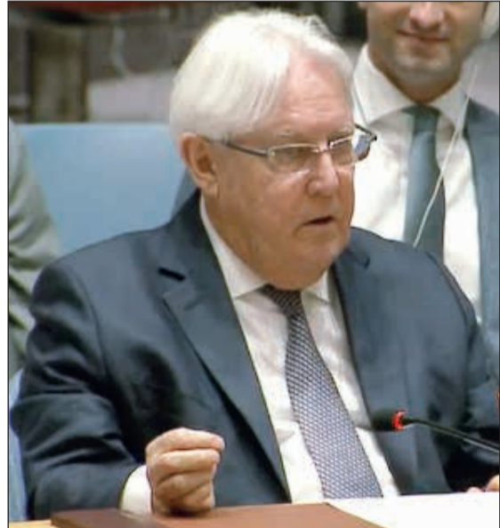
مبعوث الأمم المتحدة إلى اليمن مارتن غريفيث

«الكويتية» تفتتح قاعة «المباركية» الخاصة بركاب الدرجتين «الأولى» و«رجال الأعمال» بمبنى الركاب T4»