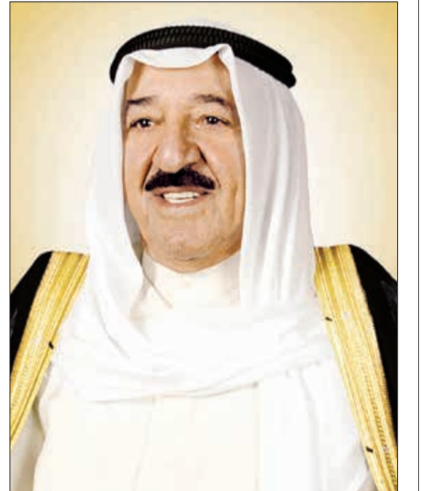
صاحب السمو الأمير الشيخ صباح الأحمد

أشاد مبعوث الأمم المتحدة إلى اليمن مارتن غريفيث بجهود صاحب السمو الأمير الشيخ صباح الأحمد ونجاحه في مواجهة تحديات الحرب وإرساء السلام. وقال غريفيث، في إحاطة خلال جلسة عقدها مجلس الأمن بشأن اليمن، «تشرفت مطلع الأسبوع بلقاء صاحب السمو الأمير الشيخ صباح الأحمد، واني لا أستطيع أن أتذكر شخصاً آخر غيره نجح في مواجهة