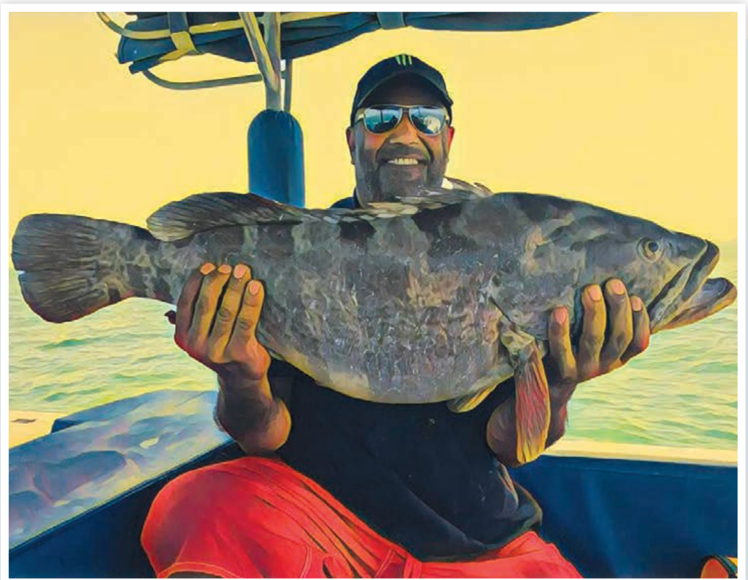
عروس الأسماك الفسكرة.. ولفاح الشيمة يبي فهامية وتعب وفن