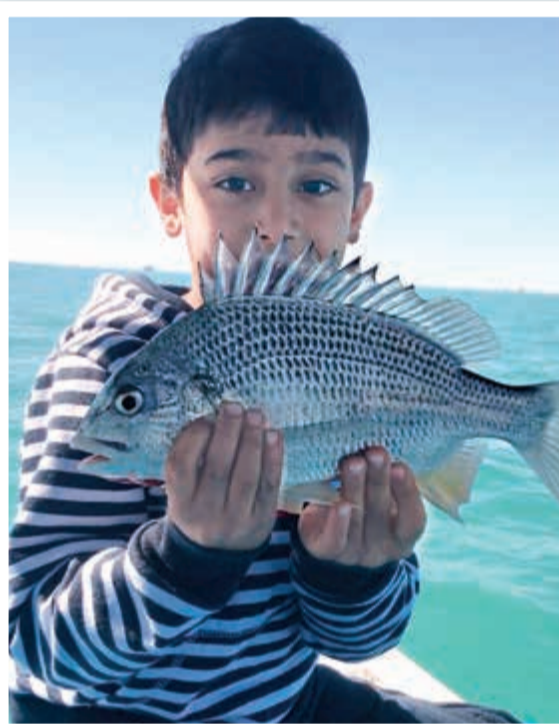
له الريبان والميده والخناق والبروج.