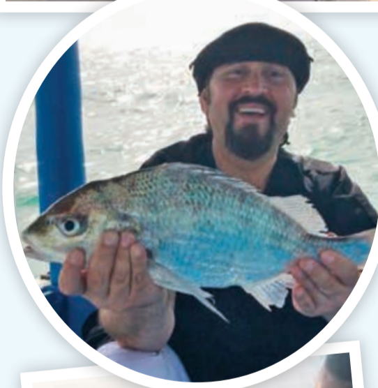
صيدها بالحق والتشخيظ بورد ولفاح.