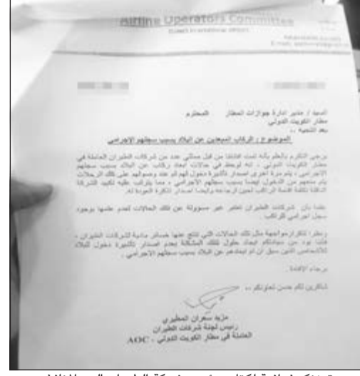
صورة زنگرافية لكتاب رئيس شركة الطيران إلى «المنافذ»