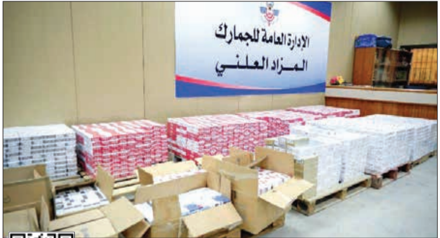
مزاك «الجمارك» شهد اقبالا كبيرا