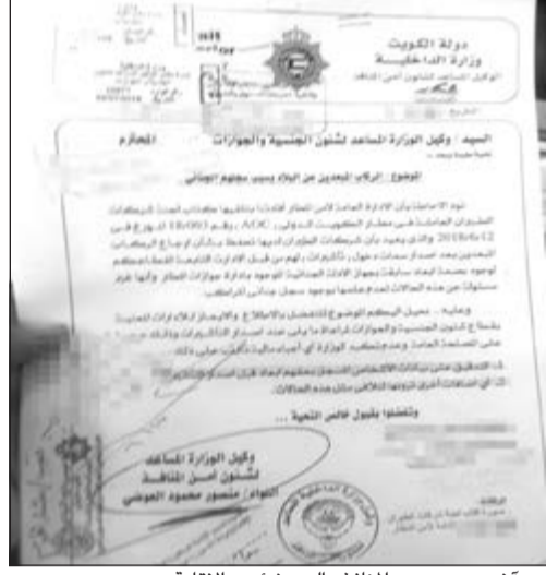
.. وأخر موجه من «المنافذ» إلى «شؤون الإقامة»