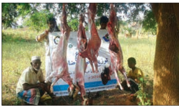
جانب من الأضاحي السابقة للجنة