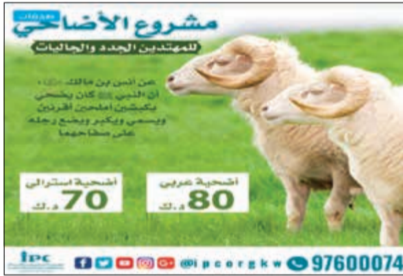
أضاحيتك أجز وسعادة