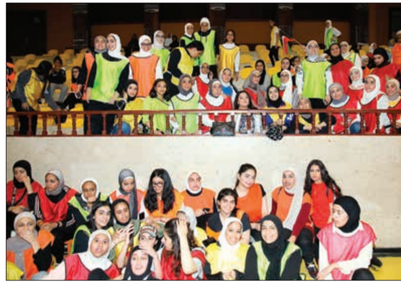
عدد من الطالبات المشاركات في اليوم الرياضي

وجسدية ونفسية لهم. كما أشار د.العززي إلى أن اليوم الرياضي يهدف إلى بث روح التنافس بين الطلبة والطالبات ونشر مفهوم الثقافة الرياضية وتعزيز اللياقة البدنية وذلك لإشباع ميولهم العلمية إلى جانب غرس روح المعرفة والبحث العلمي فيما بينهم الروح الرياضية والعمل على تدريبها وصقلها. وقد شارك في هذه الفعالية شيخ المعلق الرياضي خالد الحريان، واللاعب السابق محمد كرم أحد لاعبي منتخب الكويت في «العصر الذهبي»، كما أقيمت مباراة ودية بين فريق ضم الموظفين القائمين على الدورة التدريبية والمؤسسات الداعمة للدورات الطلابية.