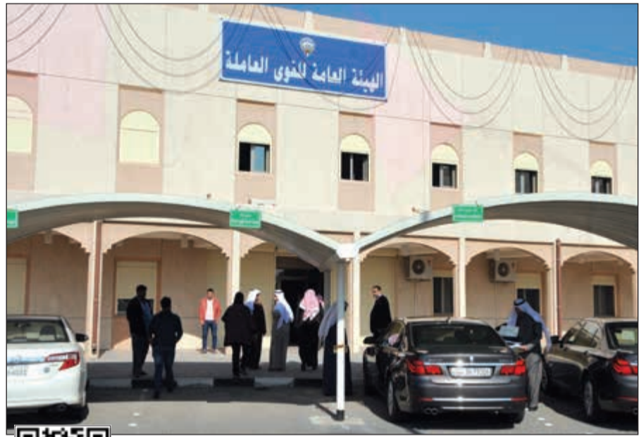
مبنى الهيئة العامة للقوى العاملة