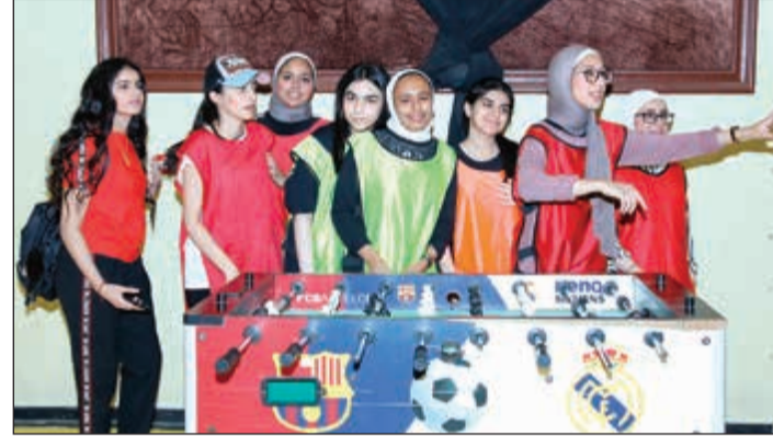
جانب من اليوم الرياضي (زين علام)