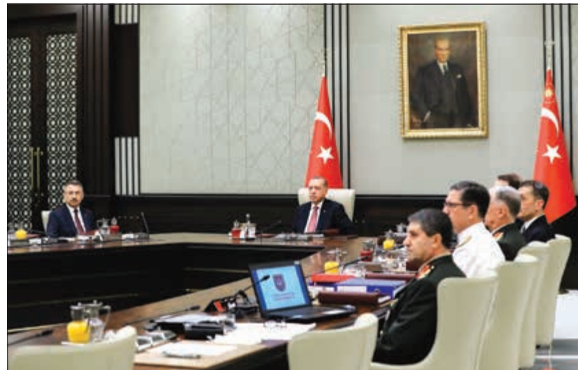
الرئيس رجب طيب أردوغان مترشحا لاجتماع مجلس الشورى العسكري في أنقرة أمس