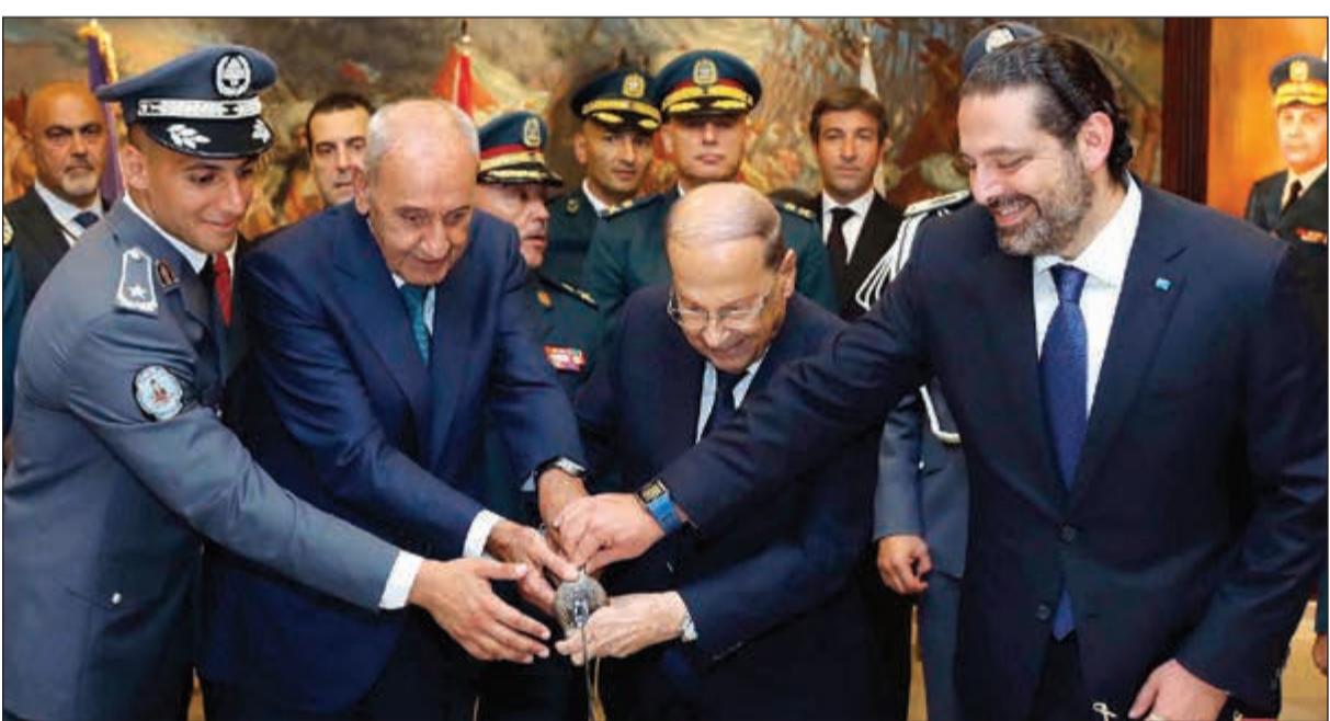
الرئيس العماد ميشال عون ورئيس مجلس النواب نبيه بري ومجلس الوزراء سعد الحريري وطلبع الدورة المتخرجة خلال قطع قالب الحلوى بمناسبة عيد الجيش

مجلس المطارنة الموارنة الذي اجتمع في الديرمان برئاسة بطريك بشارة الراعي اسف لعدم تشكيل الحكومة، واطمان للمبادرة الروسية، وهدأ النازحين السوريين، وهنا الجيش بعيده.