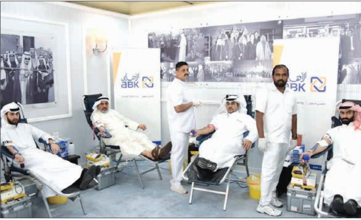
جانب من تبرع أسرة «الأهلي المتحد» بالدم

الكويتي المستمرة ودعمه المتواصل لحملة التبرع بالدم، وأثنى على دور البنك باعتباره مساهماً فعالاً في خدمة المجتمع والمسؤولية الاجتماعية.