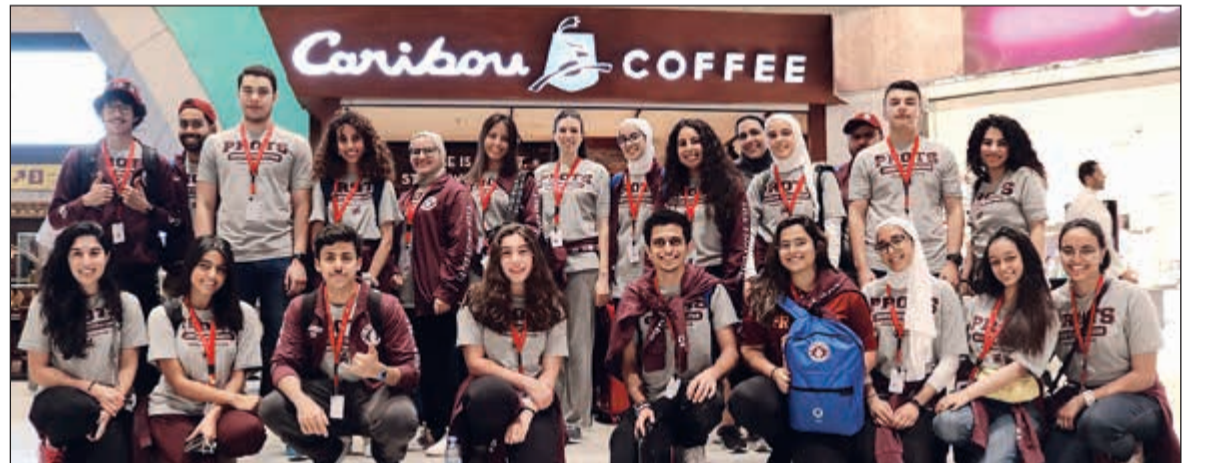
لقطة تذكارية لفريق «البروتيجيز»

لبرنامج البروتيجيز إيماناً وقالت: «نود أن نتقدم بجزيل الشكر والعرفان لصاحب السمو الأمير الشيخ صباح الأحمد، حفظه الله ورعاه، وسمو ولي العهد الشيخ نواف الأحمد، حفظه الله ورعاه، على دعمهما وتشجيعهما الدائم وإيمانهما القوي بالمنظمة وأهدافها». وصرحت الرشيد بانه وكما عهدنا من برنامج البروتيجيز على مدار الأعوام السبعة الماضية بأن من شروط إكمال برنامج الأجيال المشاركة هو السفر لمدة أسبوعين لدولة أخرى لما له من آثار إيجابية على المشاركين في زيادة وعيهم ورفع آفاق التعلم والتفكير لديهم في بيئات أخرى غير التي اعتادوا عليها وكما جرت العادة في أجنحة برنامج البروتيجيز للجيل الثامن سفر طلبة الجيل الثامن والقائمين على البرنامج والمرشدين يوم الأحد الماضي الموافق 22 من يوليو إلى مدينة سوانزي بالمملكة المتحدة والتي تم العثور بها لمدة 12 يوماً بدأت من 22 يوليو إلى 1 أغسطس من كجزء من البرنامج التدريبي الذي يستمر 6 أسابيع داخل وخارج الكويت. وأضاف الرشيد أنه تم اختيار هذه المدينة بالتحديد