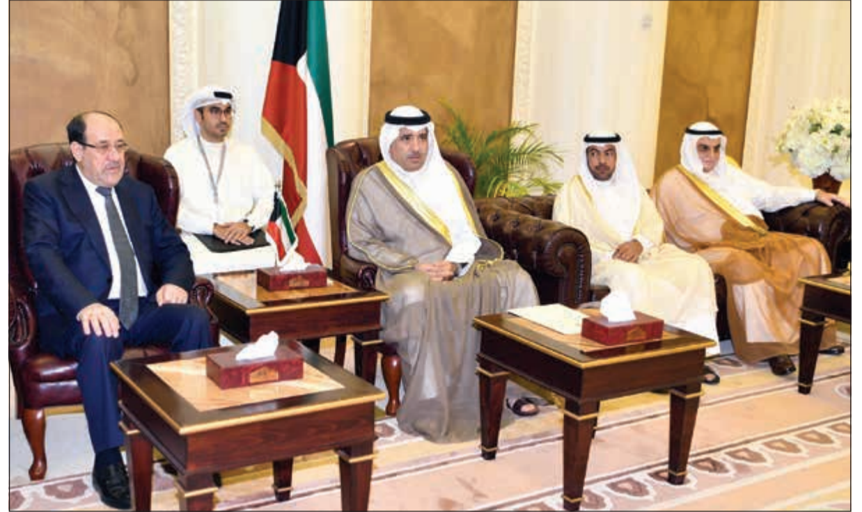
رئيس مجلس الأمة بالإجابة د.عودة الرويعي خلال استقبله نائب رئيس جمهورية العراق نوري المالكي بحضور علي الدقباسي والمستشار بالديوان الأميري خالد الفليح

وأن تكون الحقبة الماضية قد انتهت بكل ما فيها. وكان رئيس مجلس الأمة بالإجابة د.عودة الرويعي استقبل في مكتبه أمس نائب رئيس جمهورية العراق نوري المالكي والوفد المرافق له، وذلك بمناسبة زيارته الرسمية للبلاد. وحضر اللقاء النائب علي الدقباسي والمستشار بالديوان الأميري خالد الفليح.