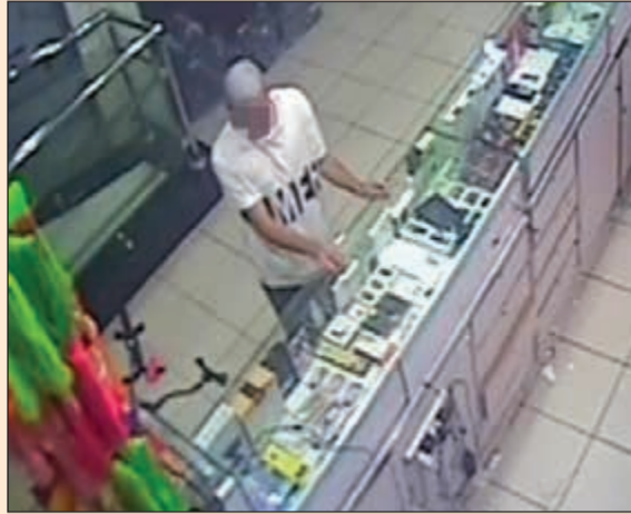
ينظر يمينا ويسارا ويحدد المسروقات