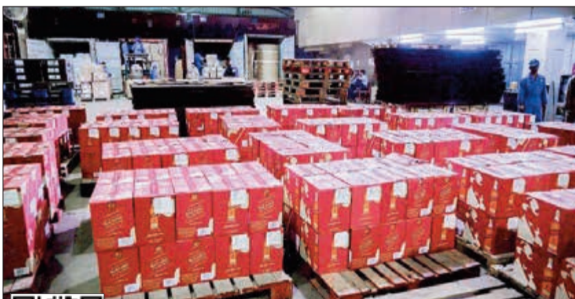
المضبوطات بلغت 539 كرتون خمر