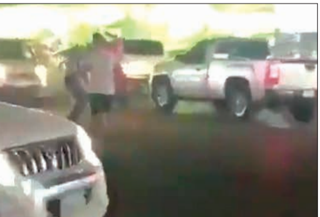
المشاجرة أشيع أنها بسبب رقصة كيكي

من جهة أخرى، تداول نشطاء على مواقع التواصل الاجتماعي مقطعاً لمشاجرة بين شخصين داخل منطقة الشويخ. هذا، ولم يعرف سبب المشاجرة التي قام المارة بتوثيقها. إلا أنه هناك من أشاع بأن سببها رقصة كيكي