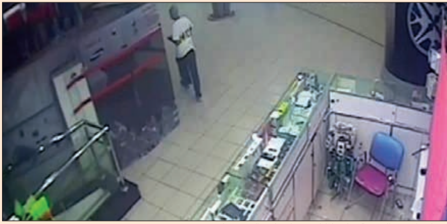
بعد انتهائه من الجريمة يغادر المكان قبل أن يلقي القبض عليه

وقال المصدر: على الفور توجهت دورية أمن ليتم مشاهدة الشاب محاطاً برجال أمن الجمعية، ويفتح تحقيق تبين ان رجال الأمن رصدوا شاباً يدخل الى الجمعية ويصعد الى الطابق العلوي والذي في الغالب قد اغلقت كل المحلات به ليتم رصده عبر الكاميرات ومشاهدته وهو ينظر يمينا ويسارا ومن ثم مديه الى الواجهة الزجاجية وسرق من داخلها 3 سماعات، واضاف رجال الامن انه تم الامساك بالشاب والعتور