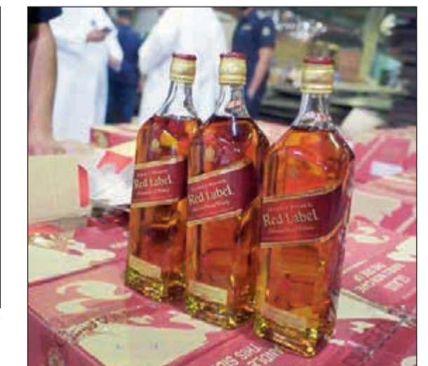
الخمر المستوردة بعد ضبطها في ميناء الشويخ