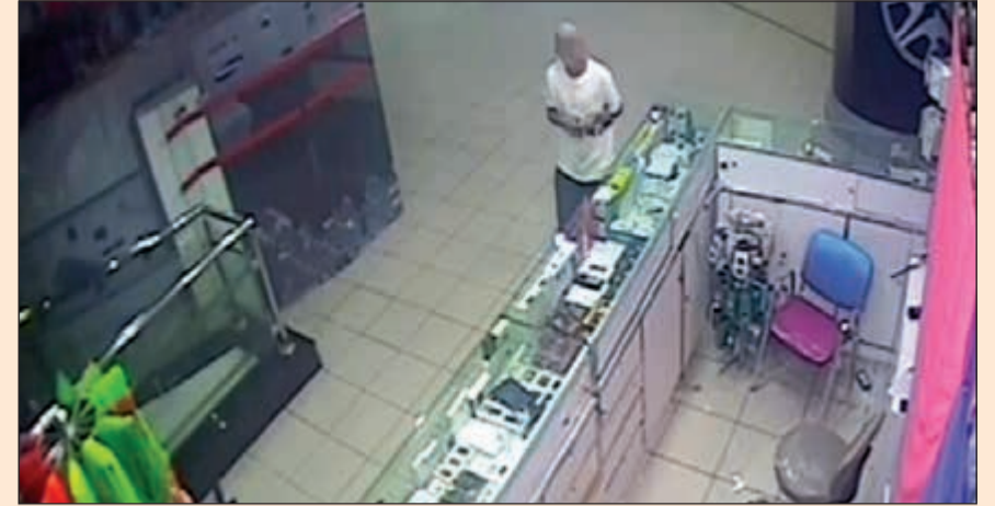
للص يستطلع الأجزاء قبل أن ينفذ واقعة السرقة