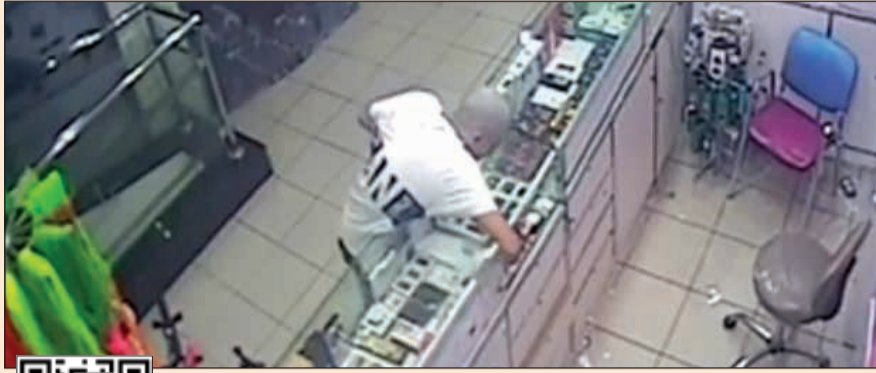
يفتح الرجلجة الزجاجية ويسرق السماعات