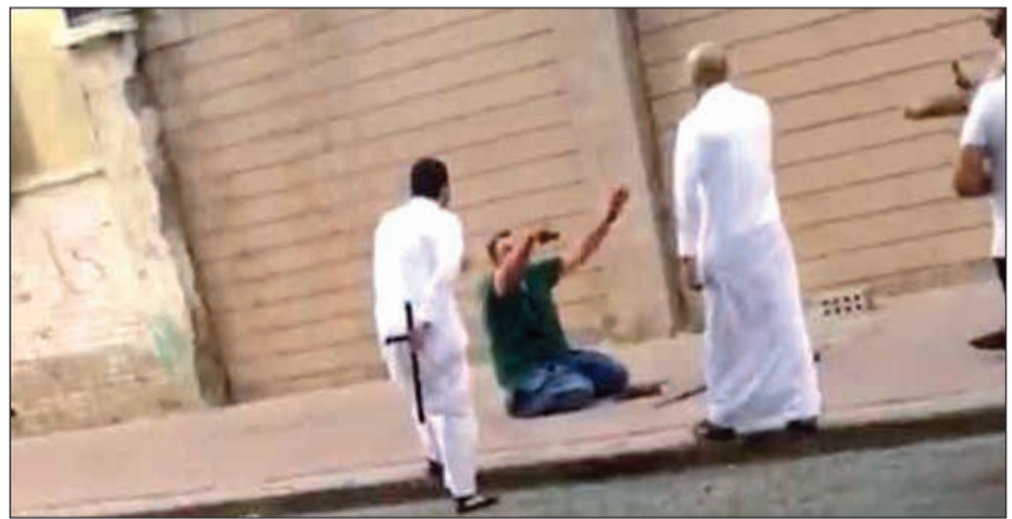
صورة أرشيفية لقاتل زوجته اللبنانية في النقرة بعد ارتكاب الجريمة

ونسخة من القرآن، حيث أرجع جريمته في التحقيق إلى أن زوجته أغضبته لما حاولت ضربه بقطعة زجاجية مخصصة لحمل الورد بعدما طلب منها القسم على المصحف بعدم علاقتها بشخصين شاهدهما ينزلان من درج البناء لحظة وجود الأبناء لدى الجيران، مضيفا أنه التقط القطعة الزجاجية وضربها بها ثم تناول سكيناً وطعنها بها حتى فارقت الحياة.