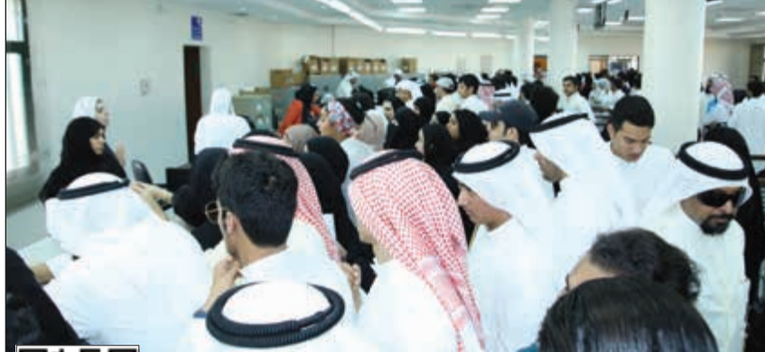
حشود من الطلبة وأولياء أمورهم لم يجدوا تجارياً من مسؤولي الهيئة للرد على استفساراتهم (زين علام)

دقات قلب المرء قاتلة له ان الحياة دقائق وثواني فارع لنفسك بعد موتك نكرها فالذكر للإنسان عمز ثاني الوصية ان تذكرت تذكرت «المحمد والشخص» الذين كان لهم فضل عليك ومنهم تعلمت واستغدت وهم في نكرياتك في أعلى مقام..! انهم «رموزك» تاج رأسك