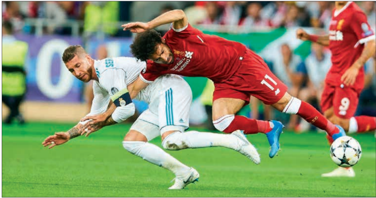
راموس تسبب في إصابة محمد صلاح في نهائي دوري الأبطال

كرر مدرب ليفربول يورغن كلوب انتقاده لقاتل ريال مدريد سيرجيو راموس بسبب خطأ عنيف ضد محمد صلاح في نهائي دوري أبطال أوروبا لكرة القدم وقال إن المدافع الإسباني أسقط اللاعب المصري وكأنه يلعب المصارعة، وقضى صلاح موسما رائعا مع ليفربول وسجل 44 هدفا في كل المسابقات وساعد النادي على التأهل إلى نهائي دوري الأبطال أمام ريال.