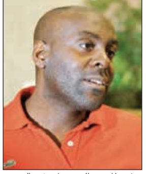
ديفيد المدرب الجديد لمنتخب اليد

تعاقد الاتحاد المصري، مؤخرا مع المدرب الإسباني ديفيد ديفيز، ليقود المنتخب ببطولة العالم للرجال.