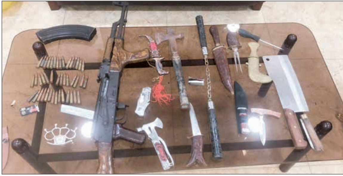
المضبوطات من السلاح الناري والأدوات الحادة احيلت لمباحث السلاح