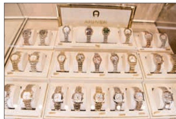
ساعات رائعة من أغنر