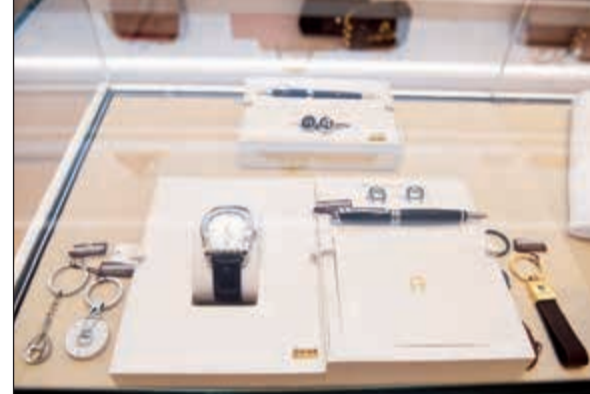
طقم متكامل من أغنر