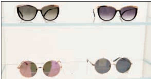
نظارات بتصاميم متنوعة