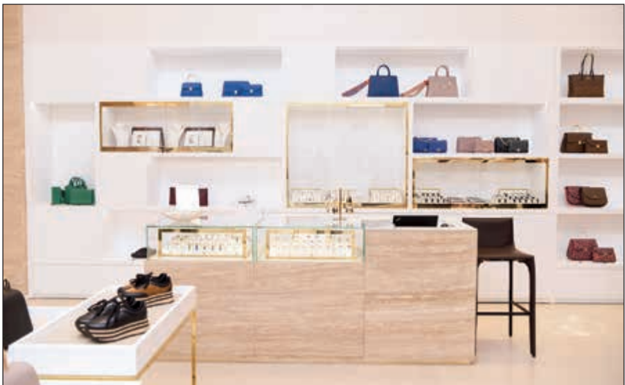
معرض أغنر يضم أروع المنتجات لأصحاب الذوق الرفيع