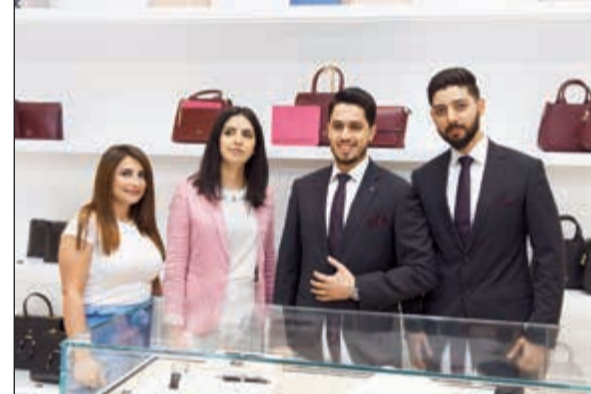
جانب من افتتاح فرع أغنر