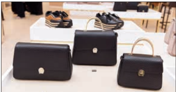
من حقائب أغنر الجذابة