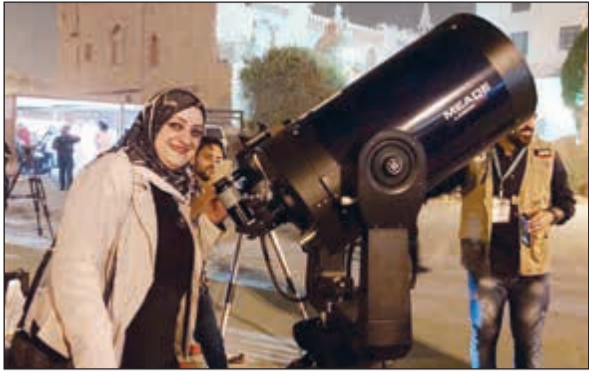
دهند الشومر متابعة الخسوف بالتلسكوب