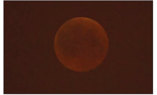
القمر الدموي خلف الغبار