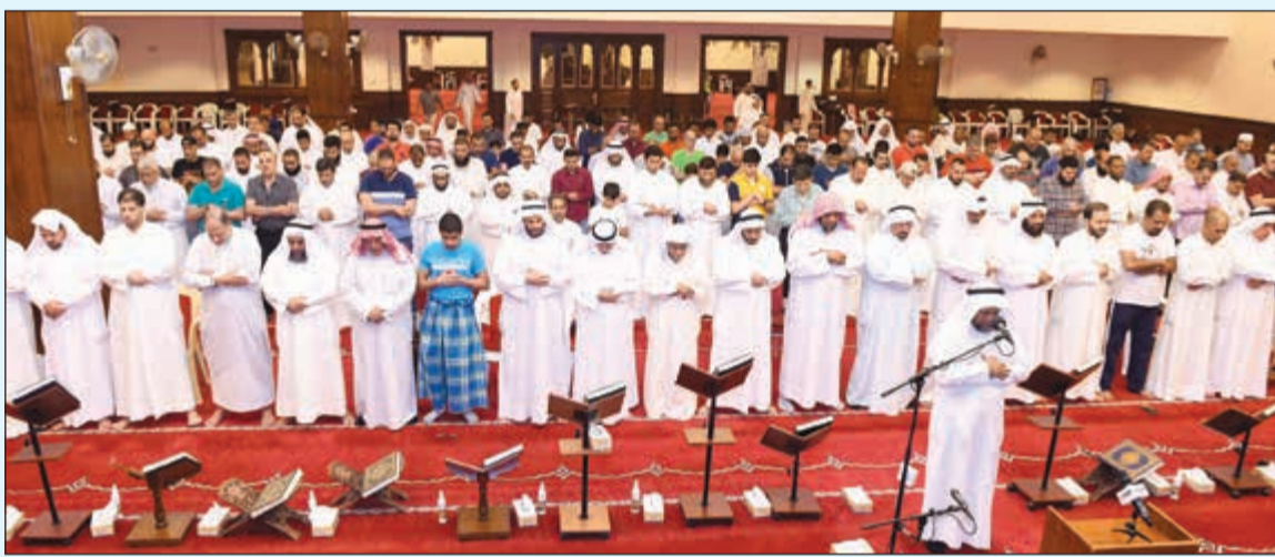
جانب من صلاة الخسوف في أحد مساجد الكويت الليلة قبل الماضية