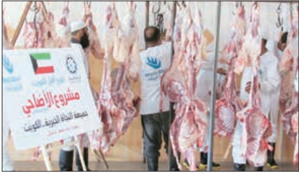
جانب من توزيع أضاحي أهل الخير