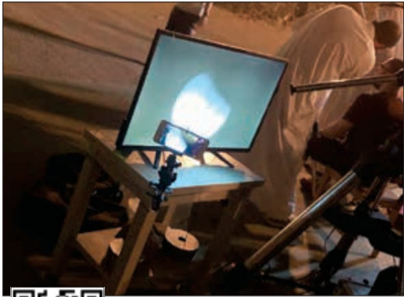
صورة لخسوف القمر في إحدى الشاشات بالمرصد

أكد أن الغبار حجب رؤية «القمر الدموي» بالعين المجردة واللون الأحمر سببه الغلاف الجوي وأشعة الشمس