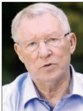
السير اليكس فيرغسون

وجه المدير الفني السابق لمان يونايتد الإنجليزي لكرة القدم، الاسكتلندي السير اليكس فيرغسون، الشكر إلى الطاقم الطبي بمستشفى «ماكسفيلد وسالفورد» الملكي على الجهد الكبير المبذول لرعايته خلال مرضه حتى تعافيه. وقال فيرغسون: «تحياتي، مجرد رسالة سريعة، أود قبل أي شيء أن أشكر الطاقم الطبي في مستشفى ماكسفيلد وسالفورد الملكي». وأضاف: «هذا جعلني أشعر بالامتنان الشديد، أشكركم على كل هذه الرسائل التي تلقيتها من كل مكان بالعالم تمنني لي الشفاء والعودة بقوة». وأشار: «أخيرا، سأعود في وقت لاحق من الموسم لمشاهدة الفريق (مان يونايتد)، وفي الوقت نفسه، أتمنى كل التوفيق لجوزيه مورينيو واللاعبين».