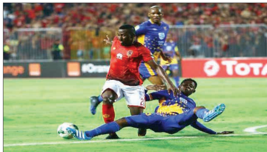
الأهلي يسعى لتكرار فوزه على تاونشيب

سيقاتل من أجل فرصته الأخيرة، رغم أن سياق المجموعة مازال في جولته الرابعة، وما زال هناك جولتان، إلا أن مباراة الليلة ستترسم بشكل بارز ملامح الفريقين الصاعدين لدور الثمانية في البطولة الأفريقية.