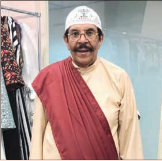
نجم السوشيال ميديا بوظلال المزبون