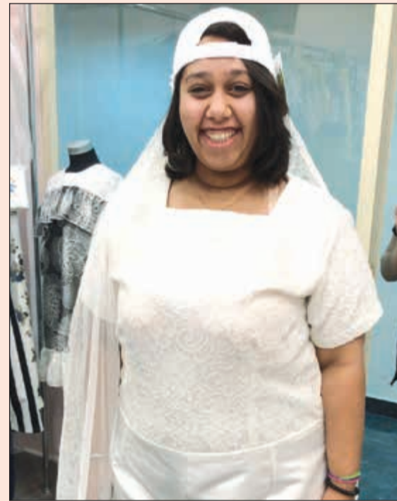
الملكة المصرية هبة العبسي