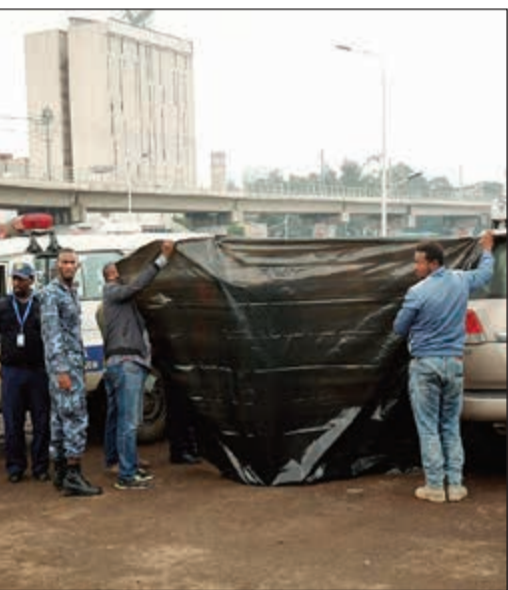
محققون يضعون ساترا لتغطية جثة بيكليبي حيث وجد مقتولا

أديس أبابا - وكالات: أعلن مدير الشرطة الفيدرالية الإثيوبي، زينو جمال، أن مدير مشروع سد النهضة الإثيوبي، سيمغنيو بيكليبي، مات مقتولا برصاصه في الرأس. وقال جمال في مؤتمر صحفي، عقده بمقر رئاسة الشرطة الفيدرالية، أمس، أن التحقيقات أثبتت مقتل م.سيمغنيو بيكليبي برصاص مسدس صباح أمس وأن الشرطة اعتقلت عددا من المشتبه فيهم، دون أن يذكر تفاصيل عنهم. وأوضح أن رصاصه اخترقت مؤخرة أذن بيكليبي هي التي أدت إلى مقتله. ولفت إلى أن الشرطة عثرت على مسدس كان موضوعا على الجهة اليمنى من القتل. وعثر في وقت سابق أمس على جثة مدير مشروع سد النهضة الإثيوبي، في سيارته، بوسط العاصمة أديس أبابا. وقالت هيئة الإذاعة والتلفزيون الإثيوبية (فانا): «عثر على م.سيمغنيو بيكليبي ميتا في سيارته صباحا في ميدان ميسكل، ونقل جثمانه إلى المستشفى للفحص الجنائي».