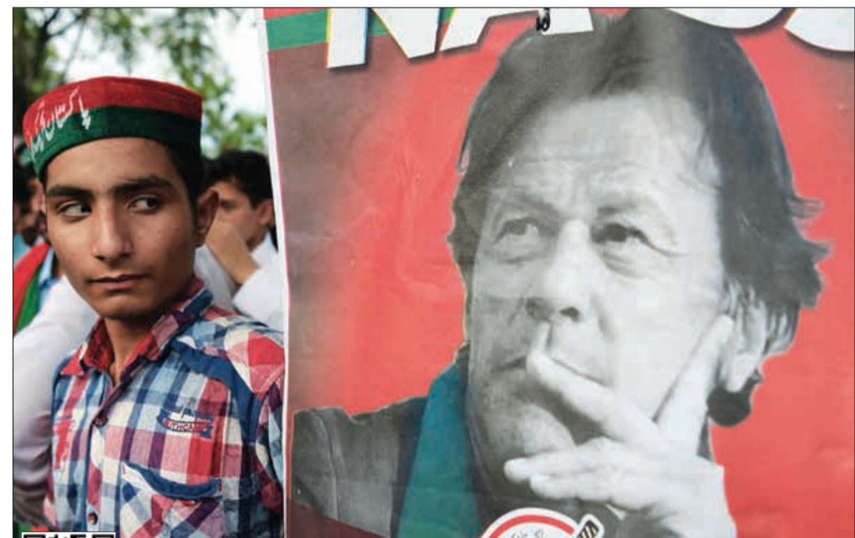
أحد انصار نجم الكريكت السابق عمران خان خلال تجمع مؤيد احتفالا بالفوز في الانتخابات