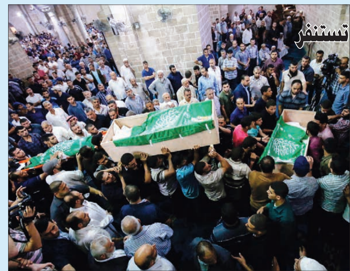
فلسطينيون خلال تشييعهم أمس جنائين الشهداء الثلاثة الذين قضا في قصف اسرائيلي (أ.ف.ب)