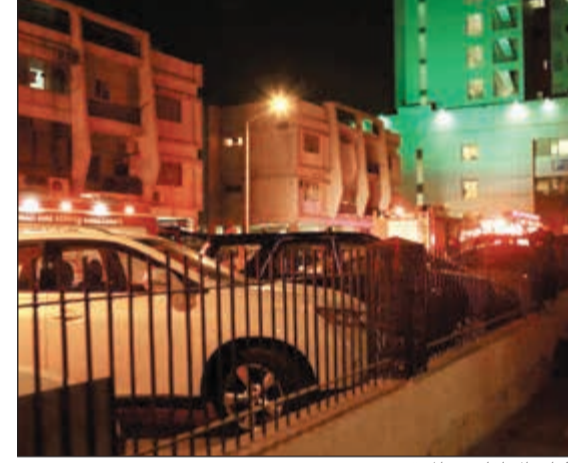
أليات الإطفاء في الموقع