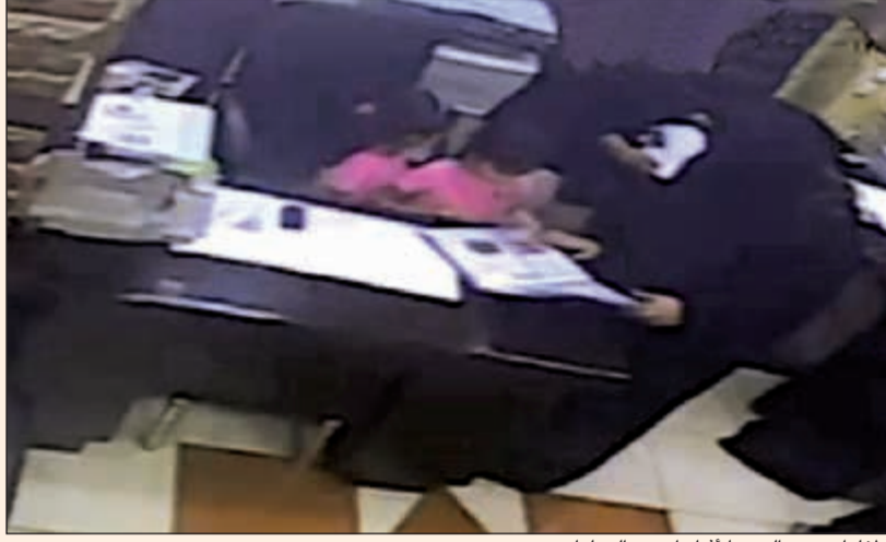
الطفلتان مع والدتهما أثناء إحدى العمليات