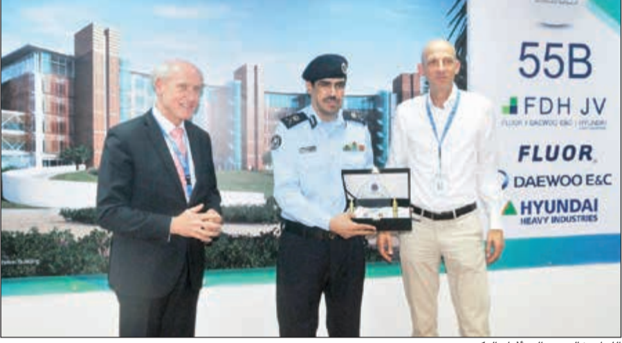
اللواء خالد عبدالله أثناء التكريم

كود الحريق البريطاني بما يتعلق بأنظمة حماية الإطفاء.