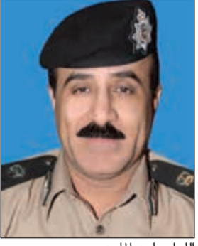
اللواء ماجد الماجد