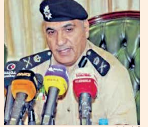
اللواء خالد الدين

تتبع خيوط الجريمة حتى تم ضبط المتهمه وتبين انها مواطنة وزوجها من فئة البدون وتستخدم طفلتها في سرقة الموظفين وتم رفع تقرير بالواقعة وجار التحقيق لمعرفة المسروقات، وقد تمكن رجال مباحث الجبراء من استرجاع آلاف الدنانير التي قامت المواطنة بسرقتها.