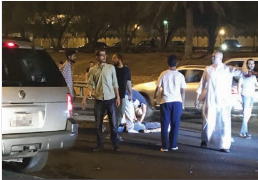
.. المصاب قبل نقله إلى المستشفى من الفحيحيل

الأولى بعد تعرضه لصعقة كهرباء أثناء أداء عمله. وقال مصدر امني ان بلاغا ورد إلى عمليات الداخلية، وهرعت على الفور دورية أمنية وسيارة إسعاف إلى موقع الحادث وعند وصولهم قام فنيو الطوارئ الطبية بنقل المصاب إلى المستشفى لتلقي العلاج اللازم.