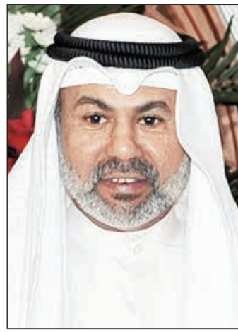
الواء الشيخ سالم النواف