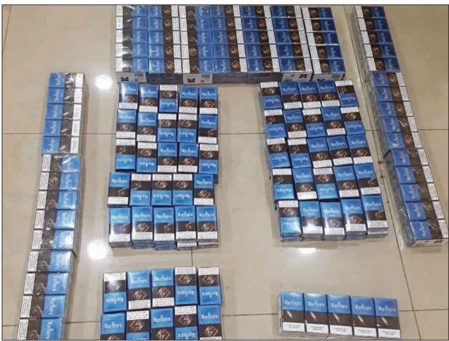
السجائر التي تم التحفظ عليها

بالتدقيق على كل المركبات سواء القادمة أو المغادرة، اشتبه المفتشون بمركبة لقيم وجودها في ساحة تفتيش المركبات لقيم تمريرها على أجهزة التفتيش الحديثة والتي جزمتم بوجود أجسام داخل المركبة. وأضاف المصدر أنه تم العثور على 30 كرز سجائر مخبأة في أجزاء داخل المركبة، لافتا إلى أن القانون يحظر حيازة أي مسافر لعدد 2 كروز لحد أقصى خلال مغادرته البلاد.