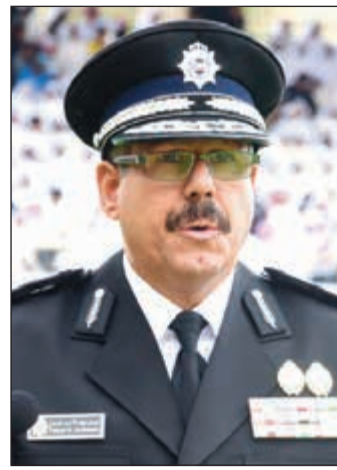
الواء الشيخ فيصل النواف