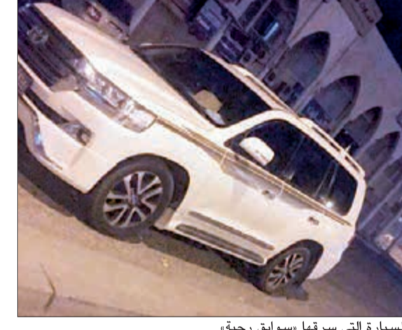
السيارة التي سرقها «سوابق رحية»

المخبر الذي نشرته «الأنباء» أمس «الأنباء» يوم أمس إلى قيامه بإطلاق النار على 3 من رجال الأمن في بر رحية وقام بسرقة مركبة المبلغ وهو مواطن. وقال مصدر أمني أن