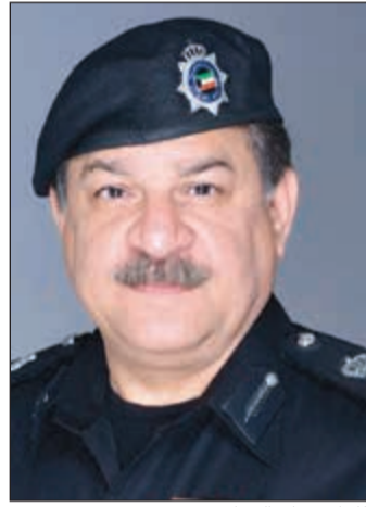
الواء جمال الصايغ