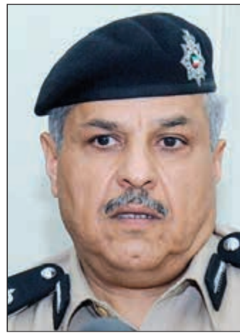
الواء الشيخ مازن الجراح