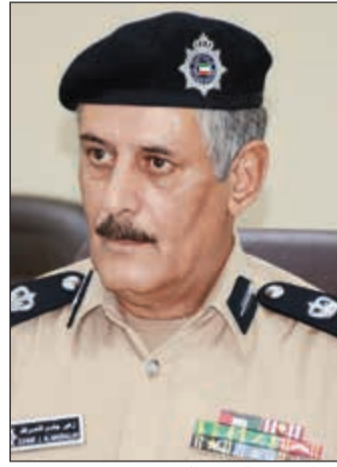
الواء زهير الناصر