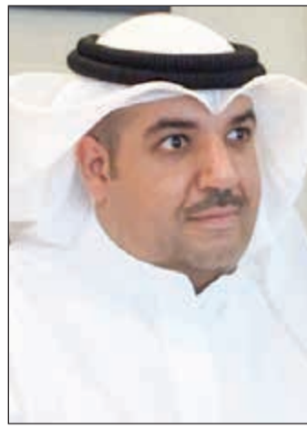
الشيخ مشعل الجابر

يعتقد البعض أو الكثير أن في وطننا فسادا، وظلما، وتزويرا، وهذا وهمٌ كبير، ولا يعرف من يقول ذلك أي شيء عن هذه الدنيا. وأقول إنه من المستحيل أن يكون في بلدي أي فساد، ولدينا الكثير من الجماليات في هذا الوطن: استثمارات، ناقلات، تأمينات، وزارات، شهادات، ديزل، مناخ، أراض تابعة لأملاك الدولة بالشمال والجنوب بمساحات كبيرة. والشرفاء والمخلصون من أصحاب الهمم والقمم يراعون ويحفظون كل هذه الأمور، والله يعطيهم ألف عافية، ويزيدهم (كمان) و(كمان)، وهذا هو الإخلاص والوفاء و(لا بلاش)!! والسؤال: إذا كنا كلنا نحن من سبق، ولا يوجد أي خطأ فينا، فمن نهب وسرق واستحل مقدرات الدولة، وفسد وظلم، وخرق القانون؟! أنتم ومنكم يا أبناء وطني الغالي المتهمون الأساسيون فيما يحدث! أنتم ومنكم من أخذ مقدرات وخيرات هذا البلد الطيب! أنتم ومنكم من يخرج بسببه كل يوم مأساة جديدة! وما نحن اليوم وأمس وغدا نعيش في مأساة (جديدة- قديمة) الا وهي قضية